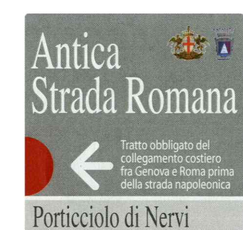
pannello metallico autoportante dim 60x190 con base in arenaria