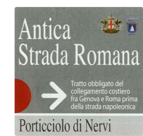
Targhe metalliche a muro o su sostegno