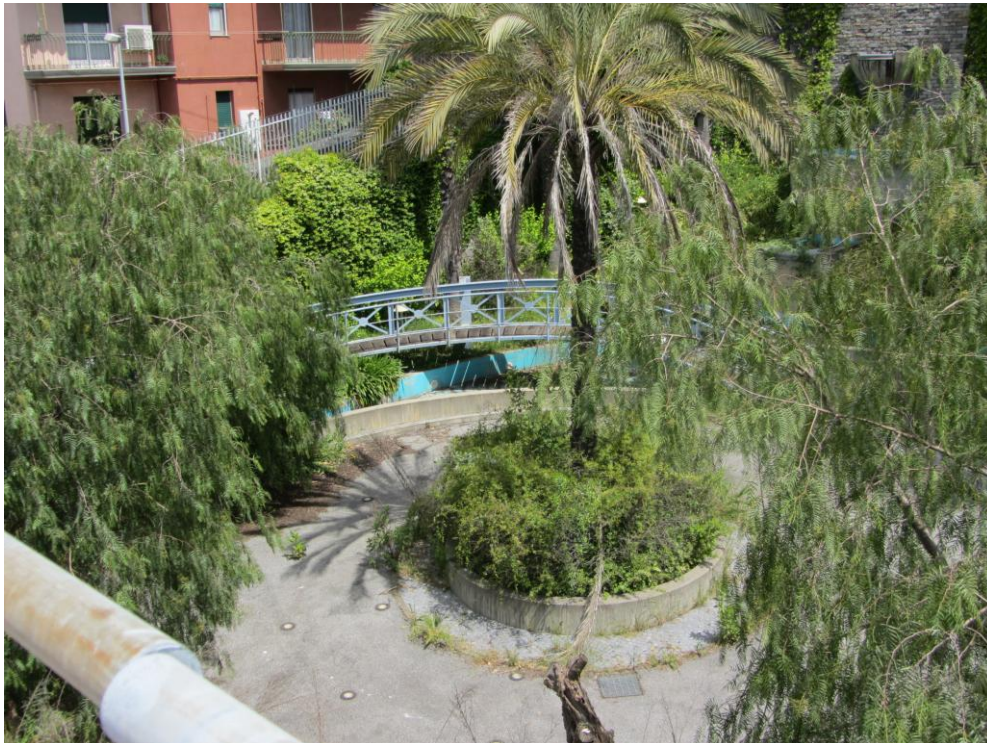
- DETTAGLIO GIARDINO LATO MONTE -

ECOSEI S.R.L. – Via Galata n° 37/8 – 16121 – GENOVA –