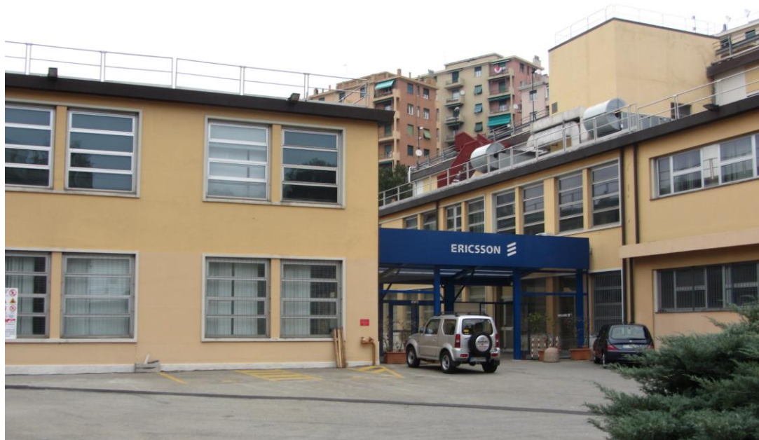
- DETTAGLIO AREA DI INGRESSO -