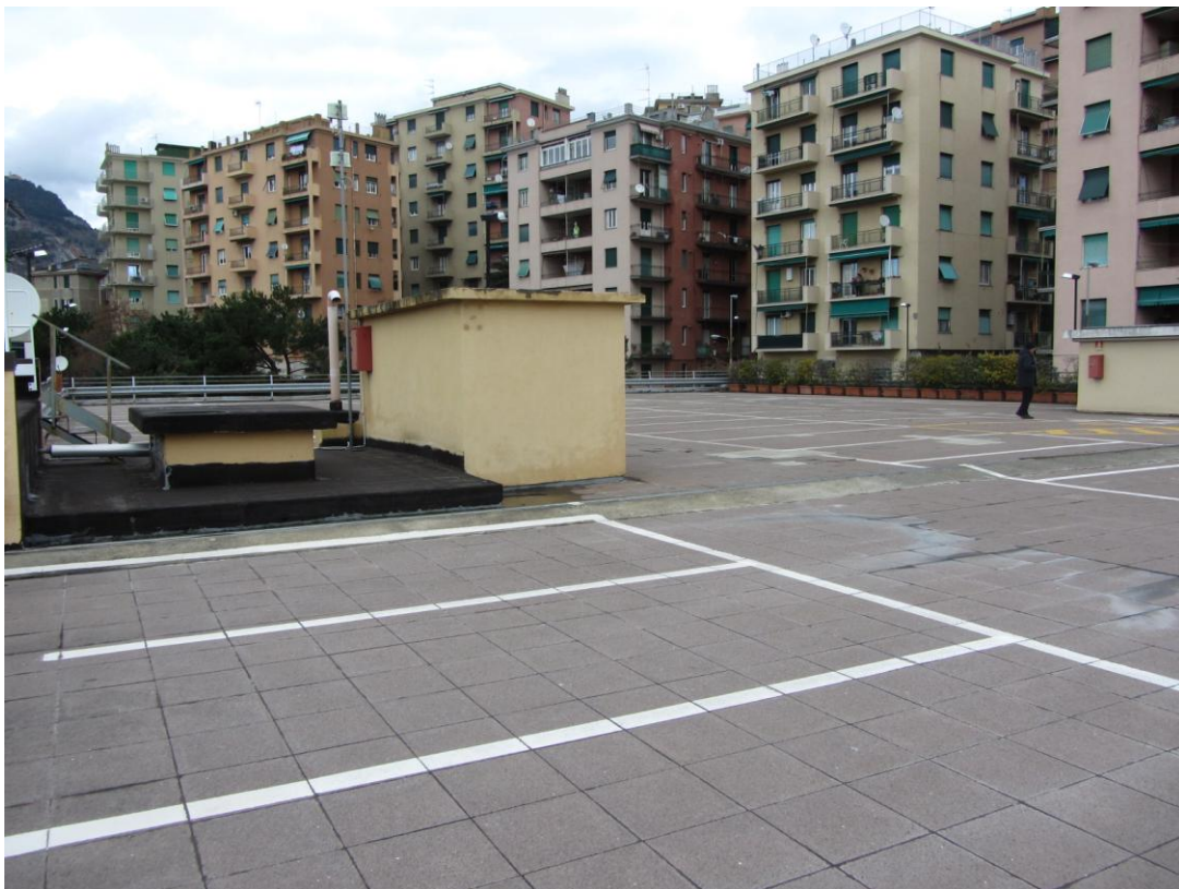
- DETTAGLIO PARK IN COPERTURA ESISTENTE -

ECOSEI S.R.L. – Via Galata n° 37/8 – 16121 – GENOVA –