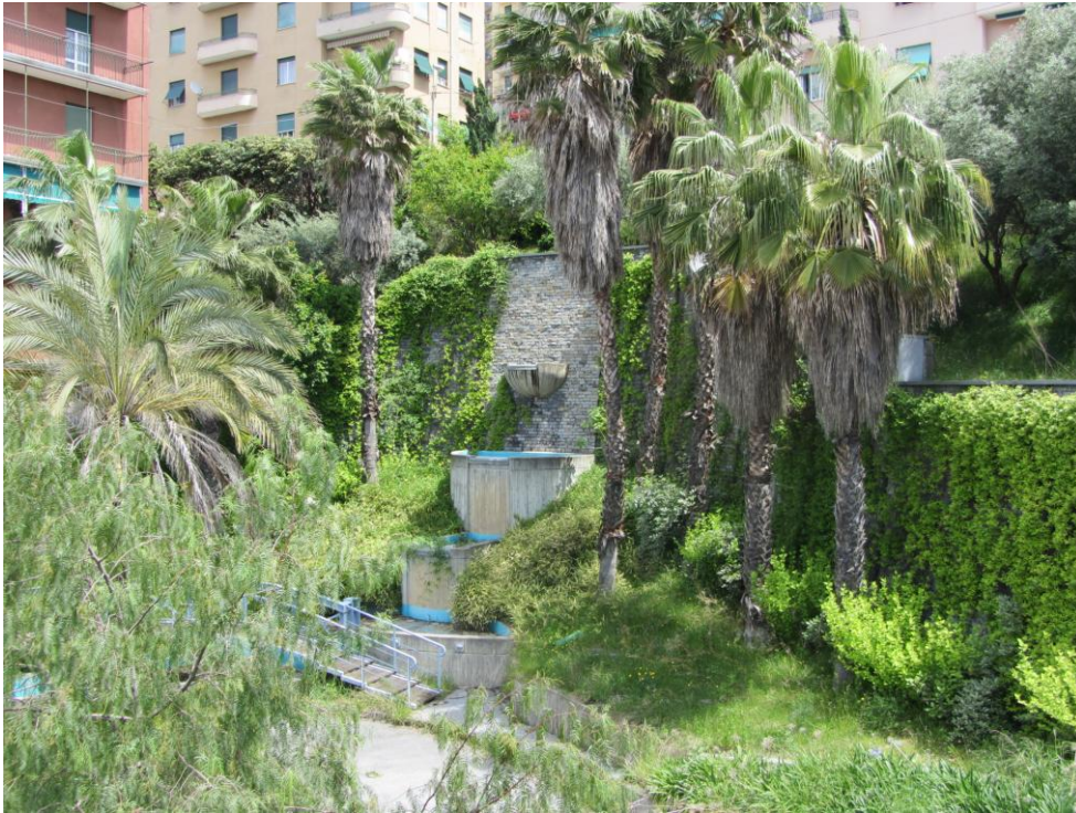
- DETTAGLIO GIARDINO LATO MONTE -