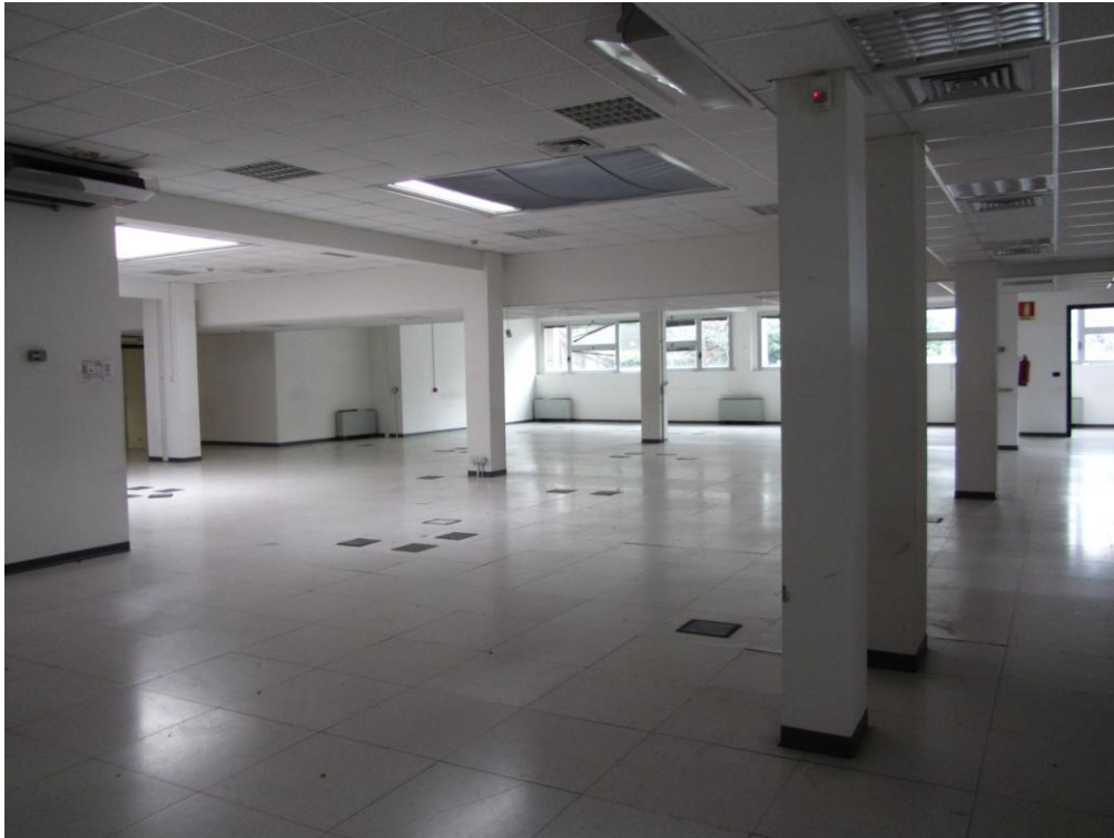
- DETTAGLIO AREE "OPEN SPACE" AI PIANI -