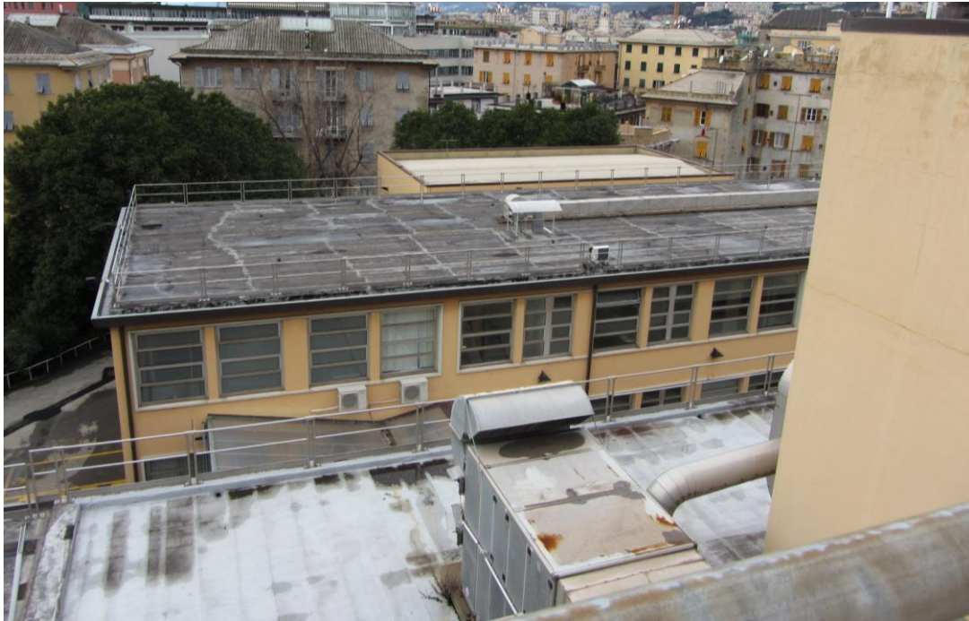
- DETTAGLIO COPERTURE ESISTENTI -