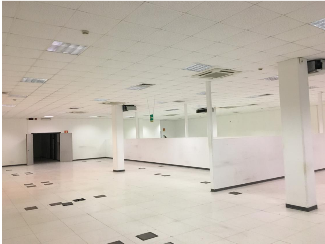
- DETTAGLIO AREE "OPEN SPACE" AI PIANI -

STUDIO CANEPA ASSOCIATI Arch. Maurizio Canepa