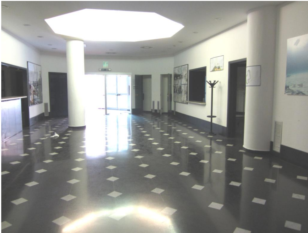
- DETTAGLIO RECEPTION AUDITORIUM -