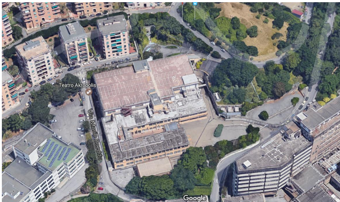
- VISTA AEREA DEL "COMPLESSO" -

ECOSEI S.R.L. – Via Galata n° 37/8 – 16121 – GENOVA –