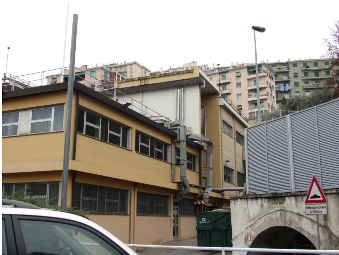
- DETTAGLIO AREA DISTACCO DI LEVANTE -

ECOSEI S.R.L. – Via Galata n° 37/8 – 16121 – GENOVA –