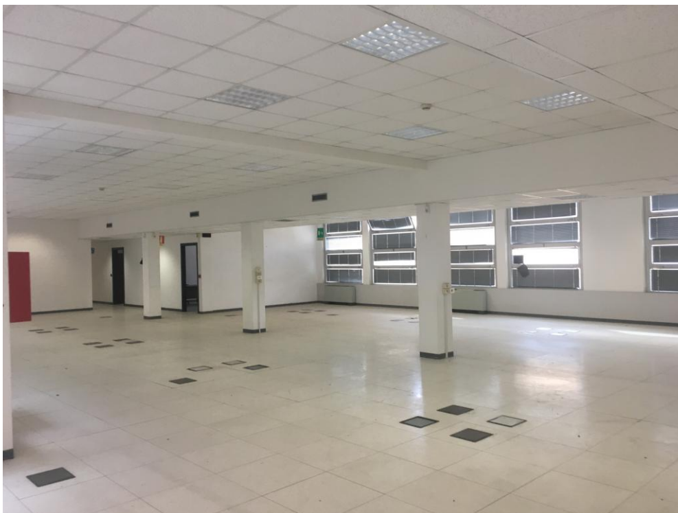
- DETTAGLIO AREE "OPEN SPACE" AI PIANI -

ECOSEI S.R.L. – Via Galata n° 37/8 – 16121 – GENOVA – - P.U.O. - SETTORE 3B DEL DISTRETTO 06 DI P.U.C. - REALIZ. DI NUOVA RSA AD ALTA E MEDIA INTENSITÀ ASSISTENZIALE E AD INDIRIZZO PSICHIATRICO EDIFICIO EX TORRINGTHON - VIA L. CALDA N° 5 – SESTRI PONENTE - DOCUMENTAZIONE FOTOGRAFICA -