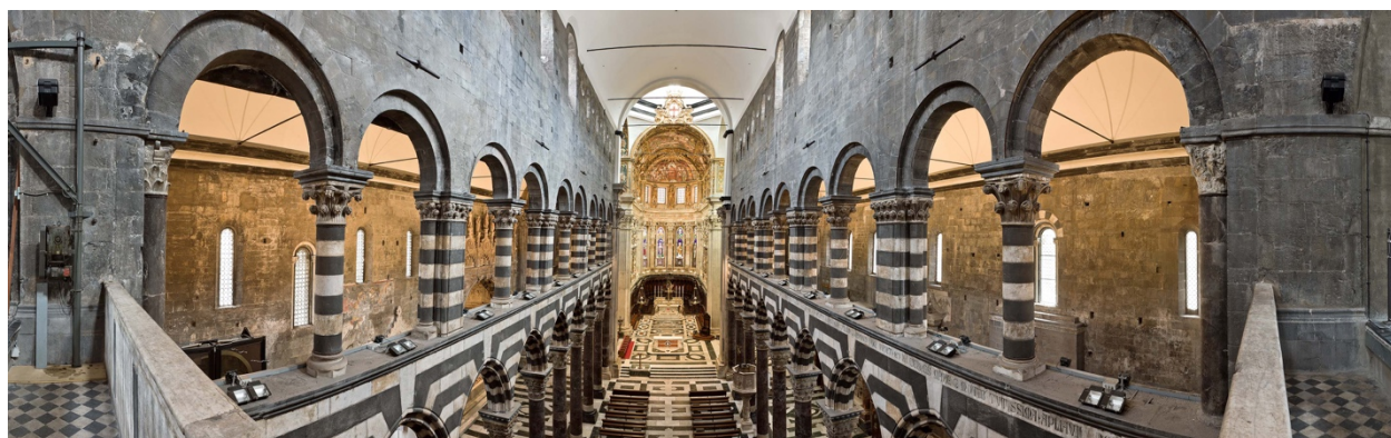
Vista della cattedrale dalla balaustra del Doge

Dopo la salita dei 67 scalini alla salita alla torre si terrà una sosta per rivivere la riservata postazione del Doge che poteva seguire la funzione senza essere visto dai cittadini