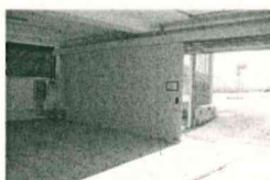
IMG_4758.JPG 884 KB