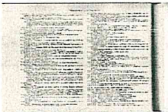
Dizionario dei Proverbi 001.jpg 229 KB