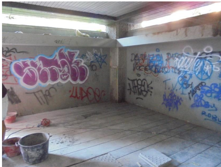
Figura 4- Muri oggetto di intervento di riqualificazione