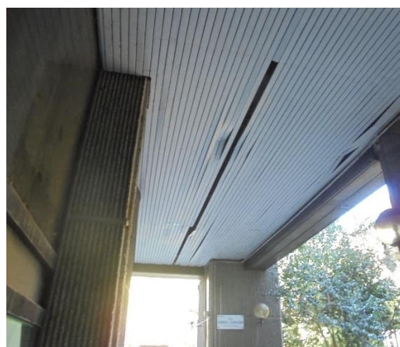
Figura 1- controsoffitti danneggiati