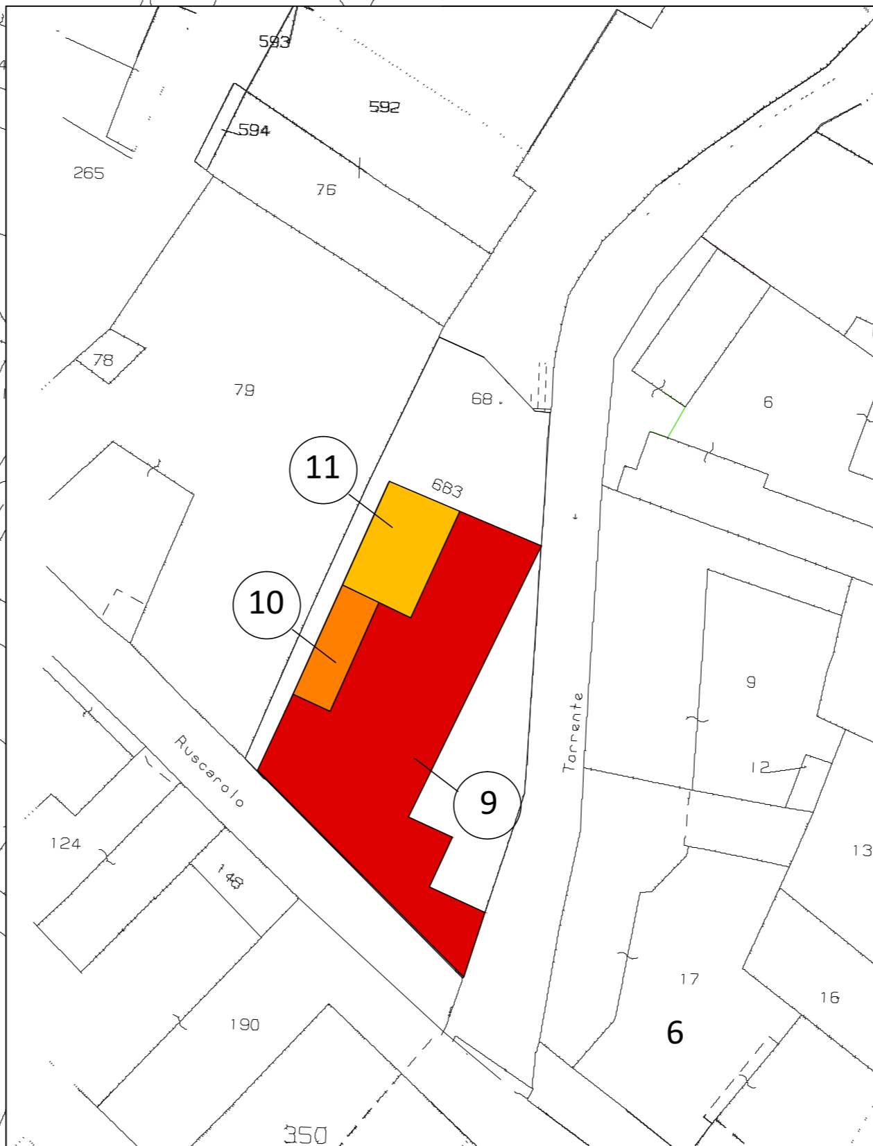
Particolare Parcelari 9-10-11 - Piano Primo

LEGENDA ■ Aree soggette ad esproprio ▨ Aree soggette ad occupazione temporanea