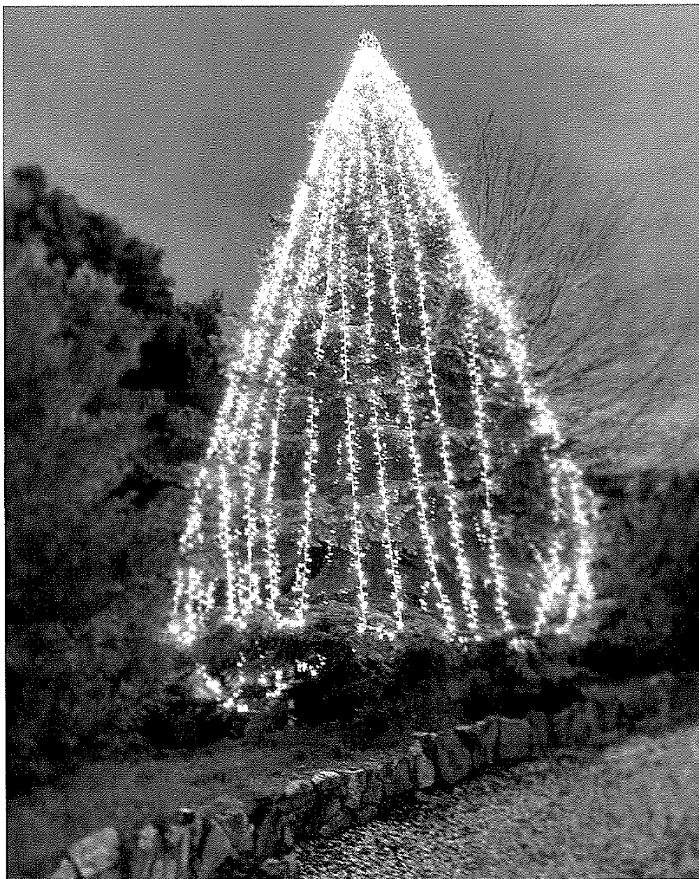
Albero a discese