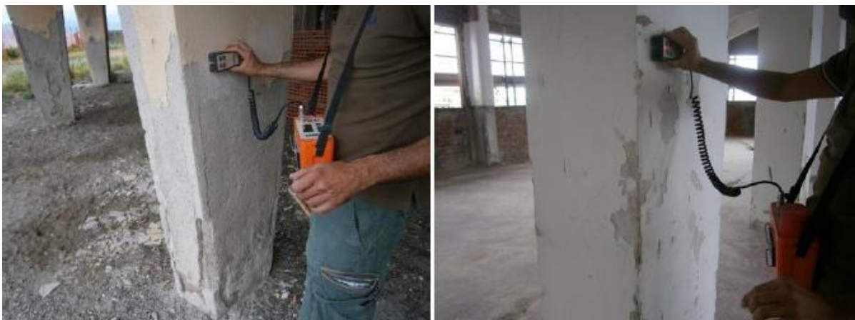
Figura 1. Realizzazione di prova pacometrica