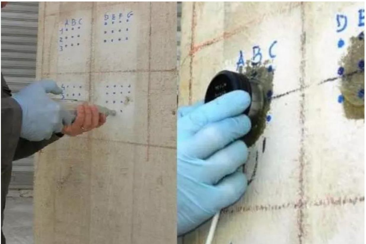
Figura 1. Metodo sonreb (analisi sclerometrica e ultrasonica)