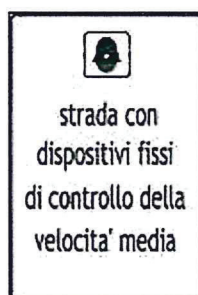
Figura 2 – Cartello di preavviso