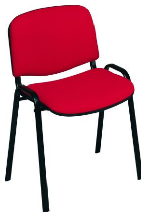
Foto della sedia