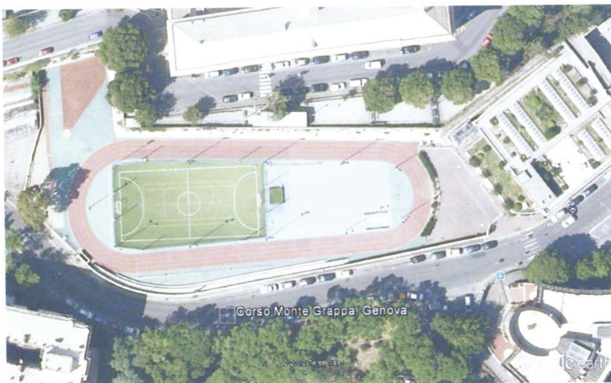
Fig. 2 Impianto sportivo di Corso Monte Grappa Genova

Questo impianto e' costituito da una pista ad anello di 200 mt a quattro corsie , da una zona centrale polivalente, da una zona per salto in alto, in lungo e per le altre discipline base dell'atletica, oltre ad una piccola gradinata per il pubblico e spogliatoi.