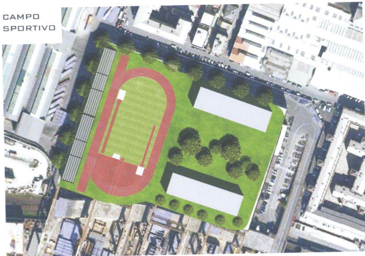
FIG. 3 Esempio di impianto di atletica leggera in area interessata da ribaltamento a mare di Fincantieri