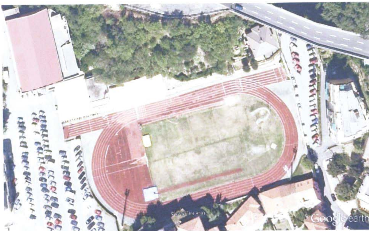
Fig.1 Impianto sportivo Marco Pala di Cogoleto Genova

Questo impianto e' costituito da una pista ad anello di 250 mt a sei corsie , da un rettilineo per la velocita' 100 mt e da una zona centrale in erba per le altre discipline base dell'atletica, oltre ad una gradinata per il pubblico, palestra e spogliatoi.