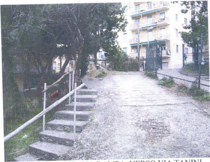
VISTA DELLA DOPPIA RAMPA VERSO VIA TANINI