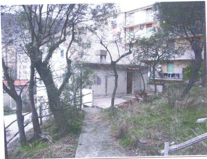
VISTA DELL'IMMOBILE VIA TANINI 11