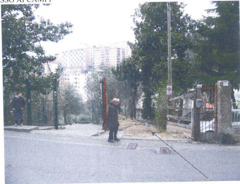
VISTA DELL'ACCESSO DA VIA TANINI 11