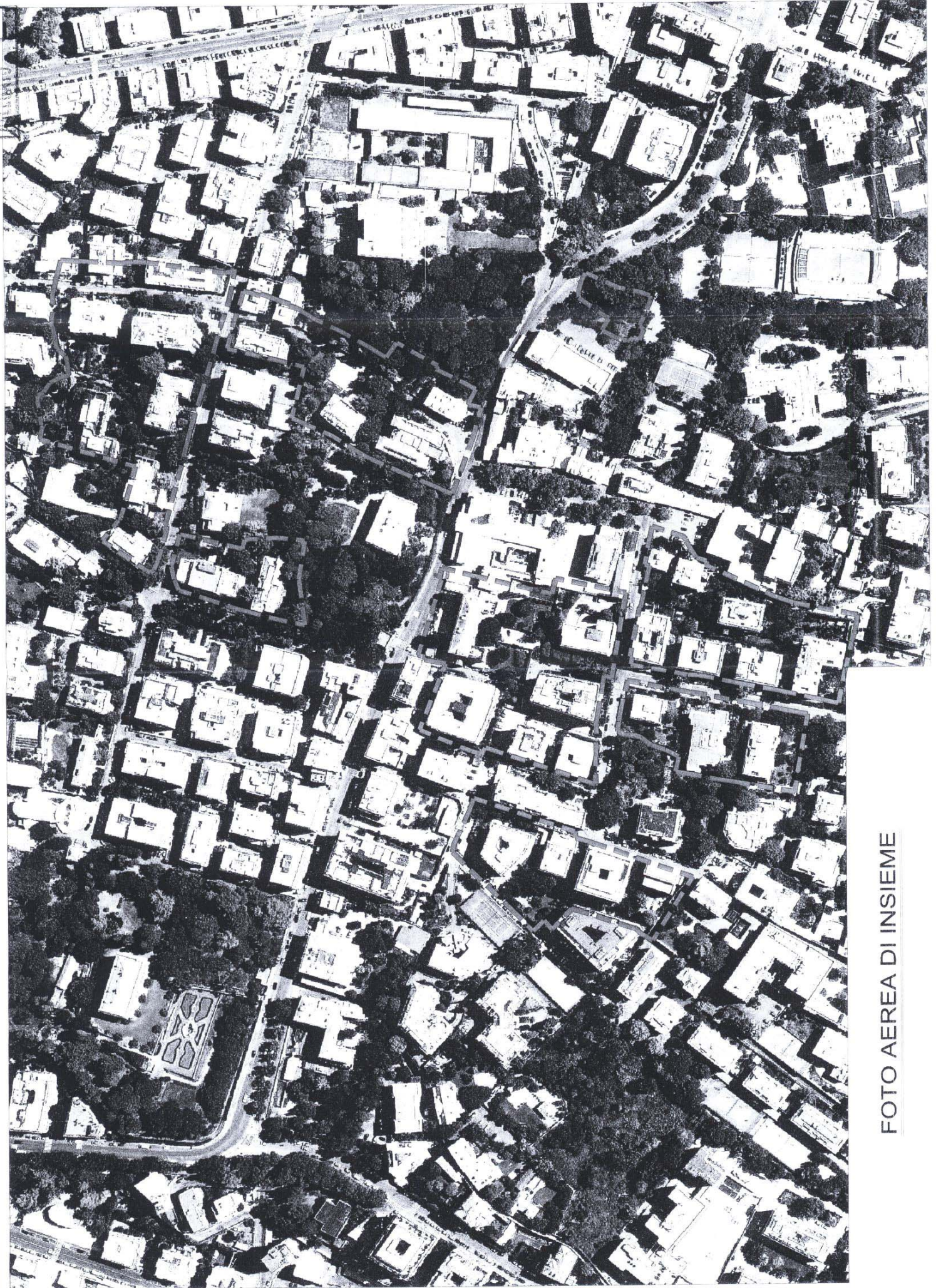
FOTO AEREA DI INSIEME