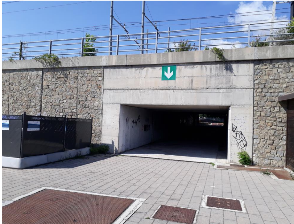
Sottopassaggio ferroviario di collegamento tra la "Passeggiata spiaggia di Pra'" ed il Parco Dapelo, situato a pochi passi dalla base/piattaforma oggetto di gara.