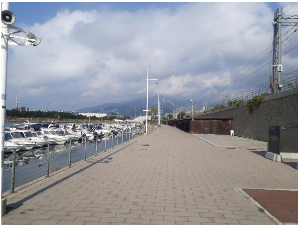
Vista Ovest della "Passeggiata spiaggia di Pra'" e a sinistra (Sud) il canale di calma della Fascia di rispetto di Pra'.