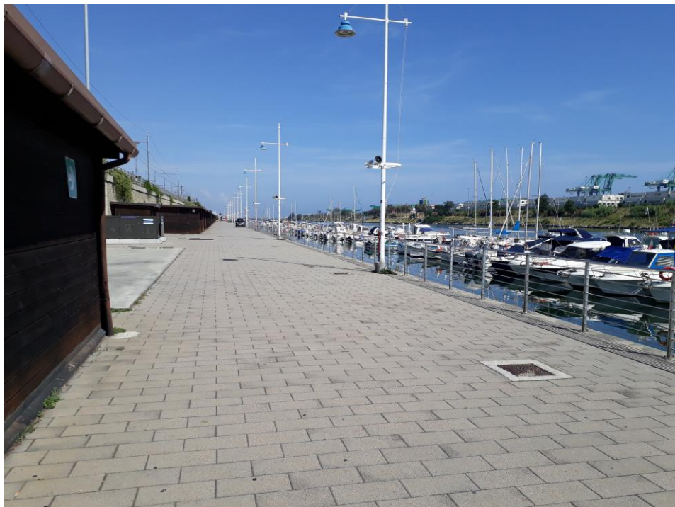
Vista Est della "Passeggiata spiaggia di Pra'" e a destra (Sud) il canale di calma della Fascia di rispetto di Pra'.