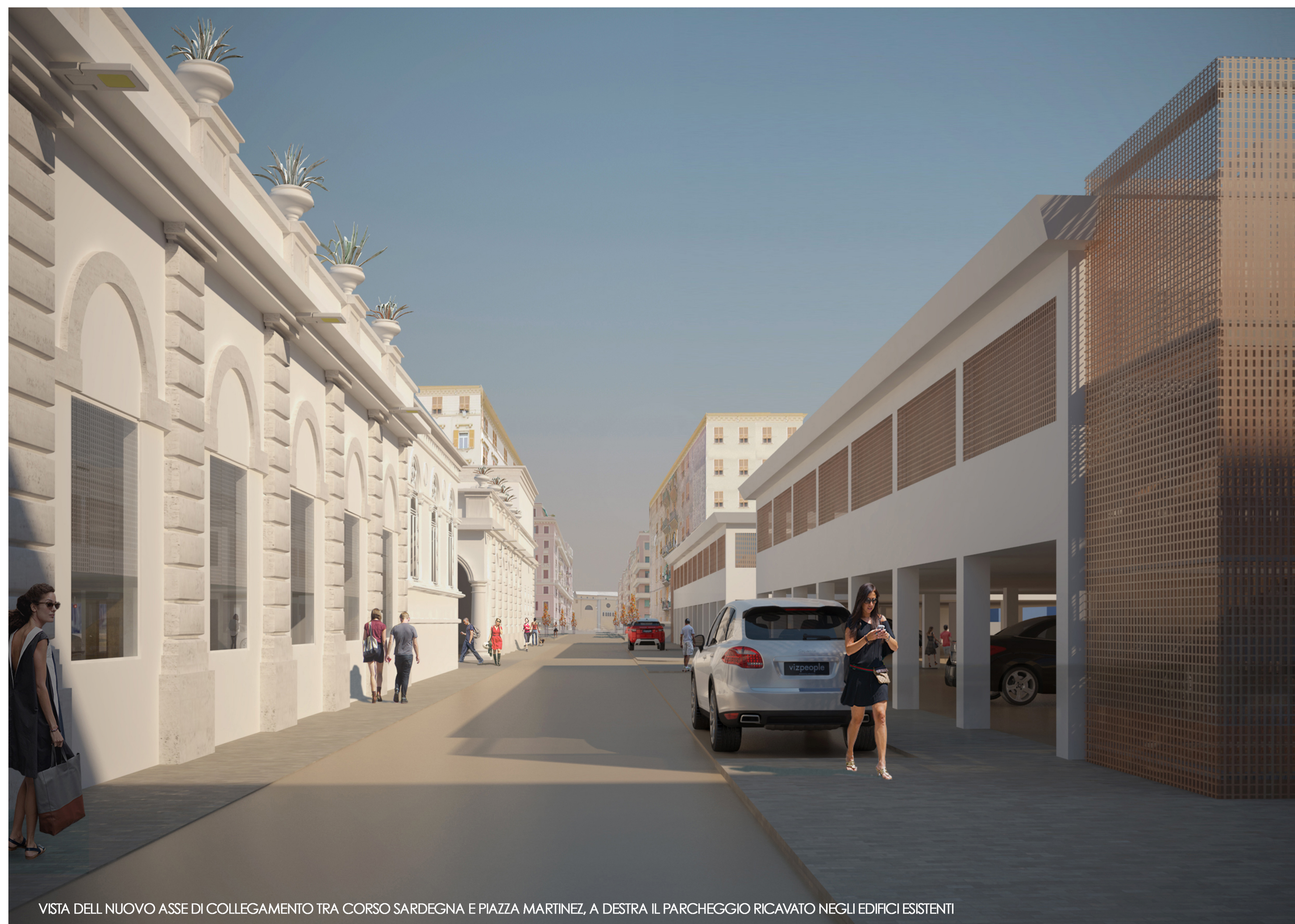
VISTA DEL NUOVO ASSE DI COLLEGAMENTO TRA CORSO SARDEGNA E PIAZZA MARTINEZ, A DESTRA IL PARCHEGGIO RICAVATO NEGLI EDIFICI ESISTENTI