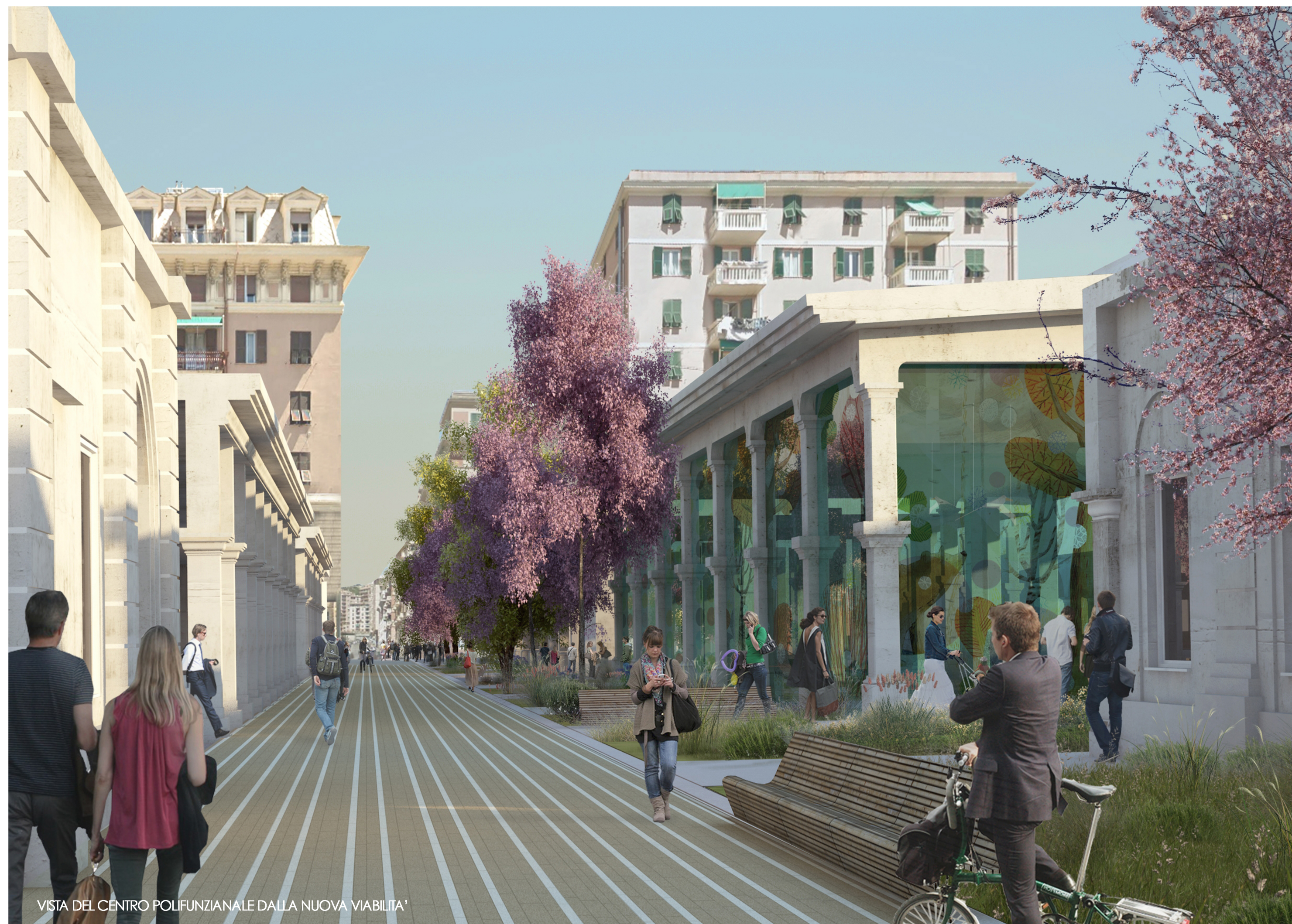
VISTA DEL CENTRO POLIFUNZIONALE DALLA NUOVA VIABILITA'