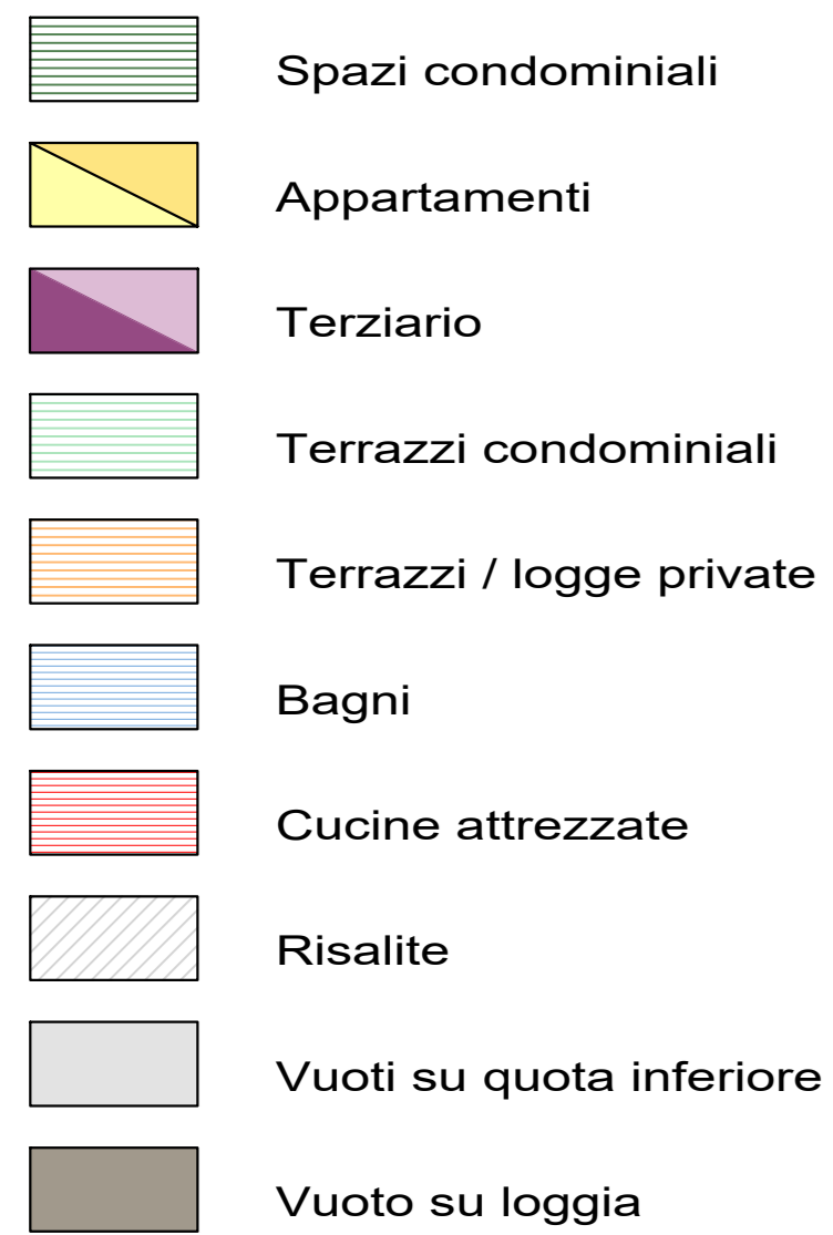
Pianta piano rialzato - livello soppalco