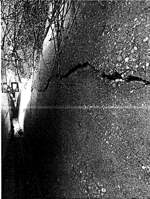
Foto 2-3: Lesione orizzontale lungo il muro di sostegno a monte della strada interessata.