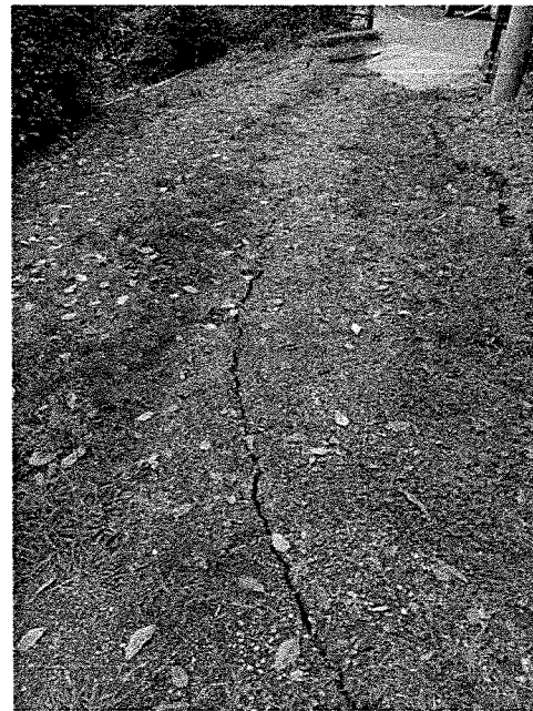
Foto 3-4: Fratture e cedimenti del terreno in corrispondenza del muro di sostegno lesionato.