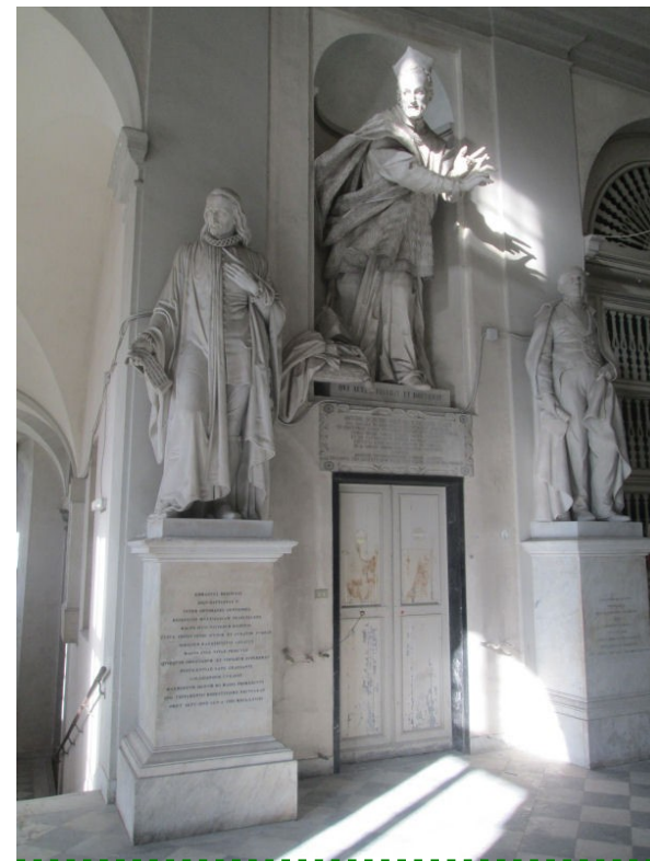
Albergo dei Poveri (ala ponente)