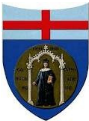
Polo Universitario dell' Albergo dei Poveri