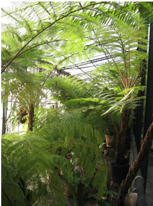
Serre comunali delle felci storiche