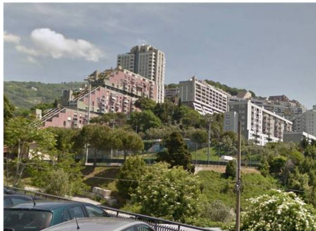
Quarto Alto avvio 15 luglio 2016