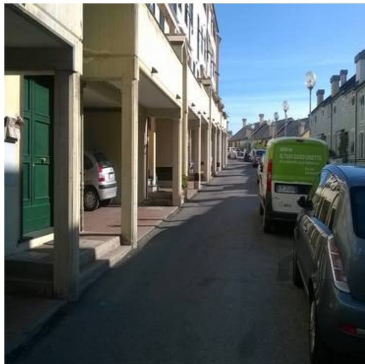
Colle degli Ometti avvio 1 giugno 2016