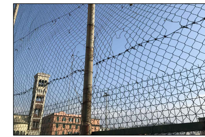
Vista 6 - Dettaglio stato rete di protezione