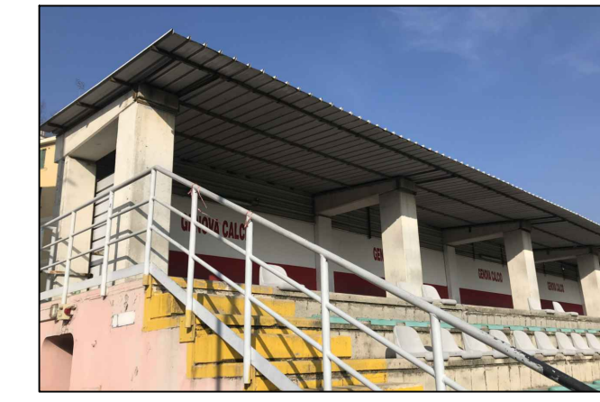
Vista 2 - Gradinate con copertura in lamiera grecata