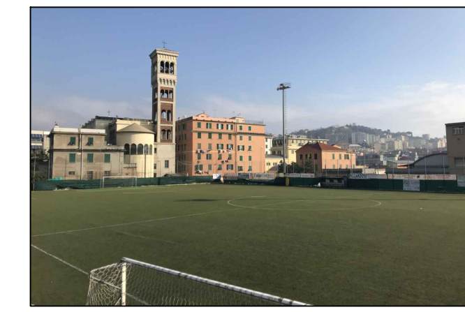
Vista 8 - Campo sportivo