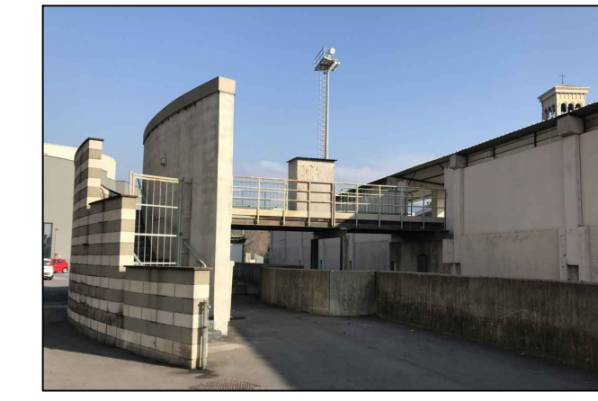
Vista 1 - Ingresso pubblico spettatori