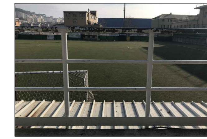
Vista 7 - Visuale dalla gradinata. Alla seduta più in basso la tettoia di copertura area atleti impedisce la vista della linea di fondo campo.