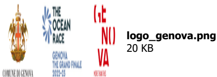
logo_genova.png 20 KB

Click here to report this email as spam.