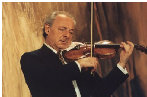
Gyorgy Pauk Premio Paganini 1956