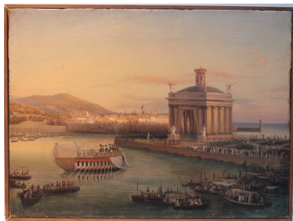
Cat. N.ro 214 (91)

I pregevoli piccoli dipinti, raffiguranti le scene dei festeggiamenti genovesi in onore della Famiglia regnante, hanno avuto storia conservativa comune fatta eccezione per il primo quadro che presenta un'intervento di restauro più recente. Gli altri tre erano stati esposti negli anni '70 in un'importante mostra cittadina come descrive il cartiglio posto sul retro dei telai; è presumibile che siano stati restaurati per l'occasione anche se uno di essi versa in uno stato conservativo peggiore.