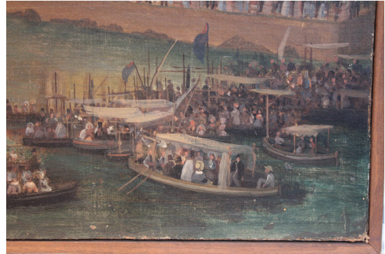
Cat. 214 dettaglio "spuliture" e danni nel mare