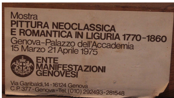
Cartiglio mostra presente sul dipinto 214

I pregevoli piccoli dipinti, raffiguranti le scene dei festeggiamenti genovesi in onore della Famiglia regnante, hanno avuto storia conservativa comune fatta eccezione per il primo quadro che presenta un'intervento di restauro più recente. Gli altri tre erano stati esposti negli anni '70 in un'importante mostra cittadina come descrive il cartiglio posto sul retro dei telai; è presumibile che siano stati restaurati per l'occasione anche se uno di essi versa in uno stato conservativo peggiore.