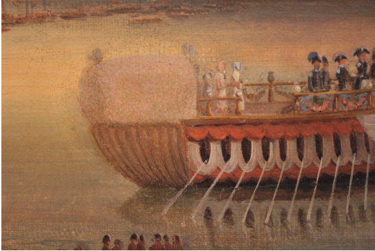
Cat. 214 dettaglio estesa reintegrazione

Il quadro ha sul retro piastre metalliche per barre espositive avvitate sul telaio.