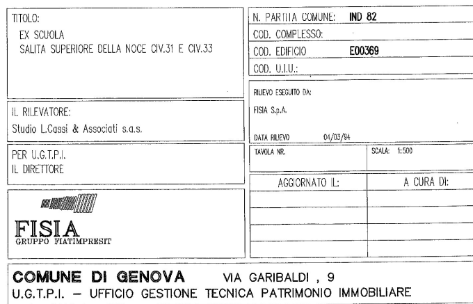
TAVOLA DI INQUADRAMENTO COMPLESSO / EDIFICIO