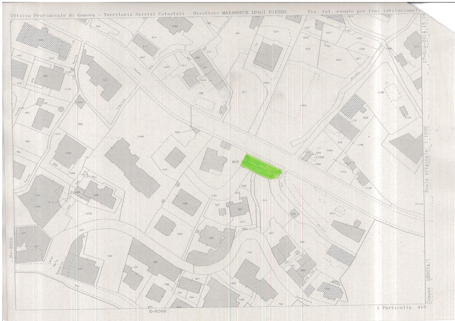
Catasto Terreni Sezione 9, foglio 9 senza mappale