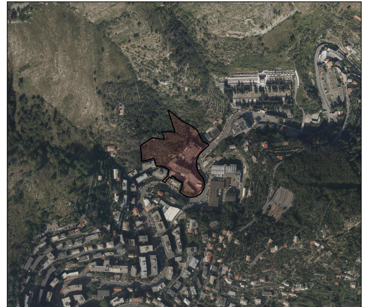
AMBITO DI RIGENERAZIONE URBANA DIST. N. 29 SCALA 1:5000