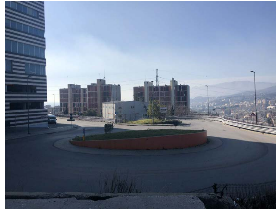
9 Vista su via Enrico Melen