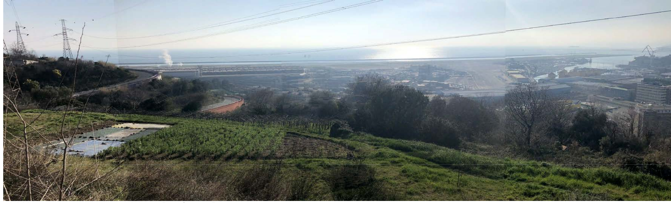
24 Vista panoramica verso sud da via Pier Giorgio Perotto