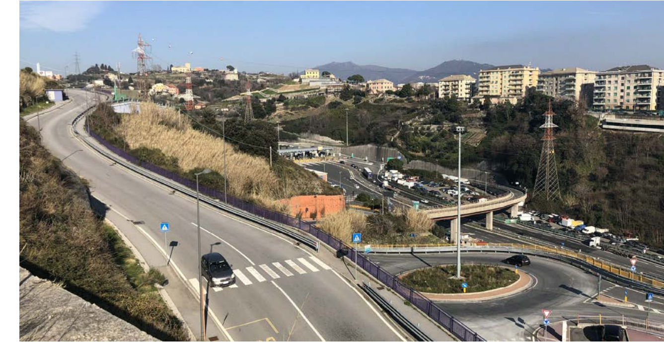
22 Vista verso nord-est da via Alessandro Vallebona