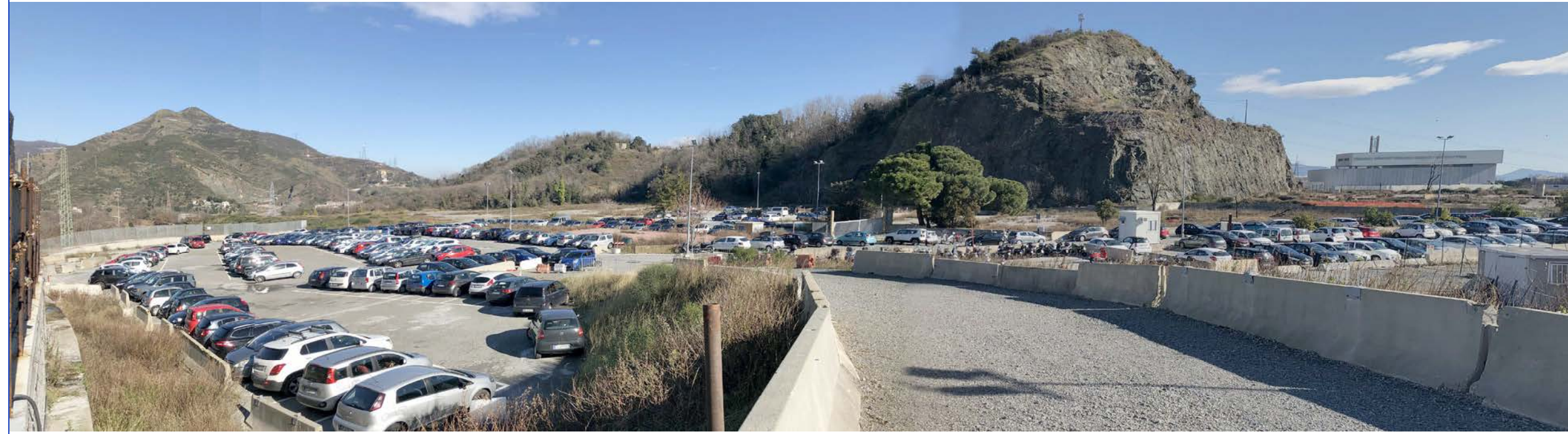
7 Vista verso Monte Guano