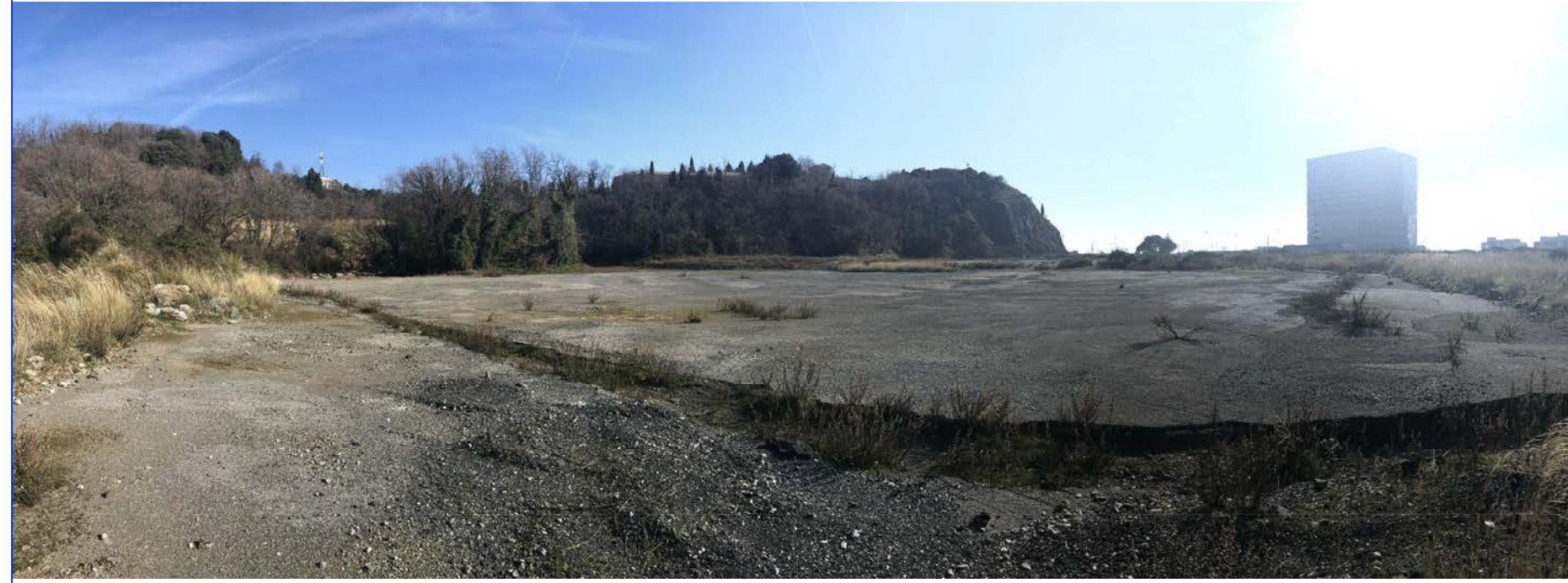
13 Vista verso sud dai piedi di Monte Guano