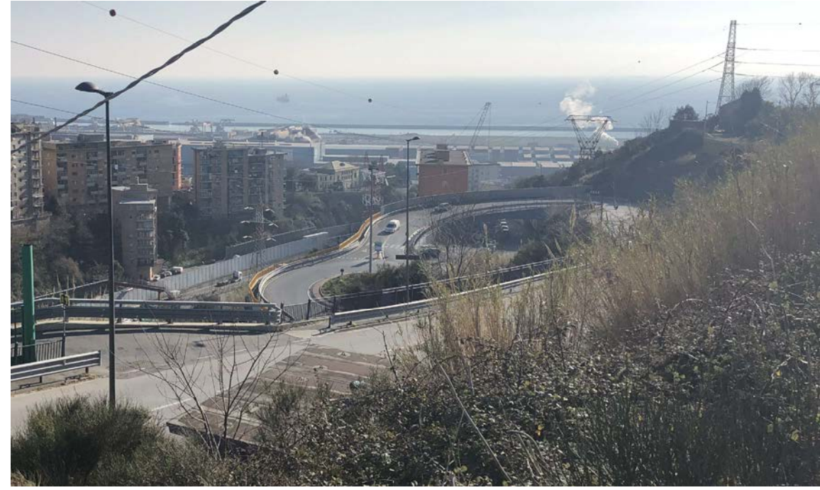
20 Vista verso sud da via Alessandro Vallebona