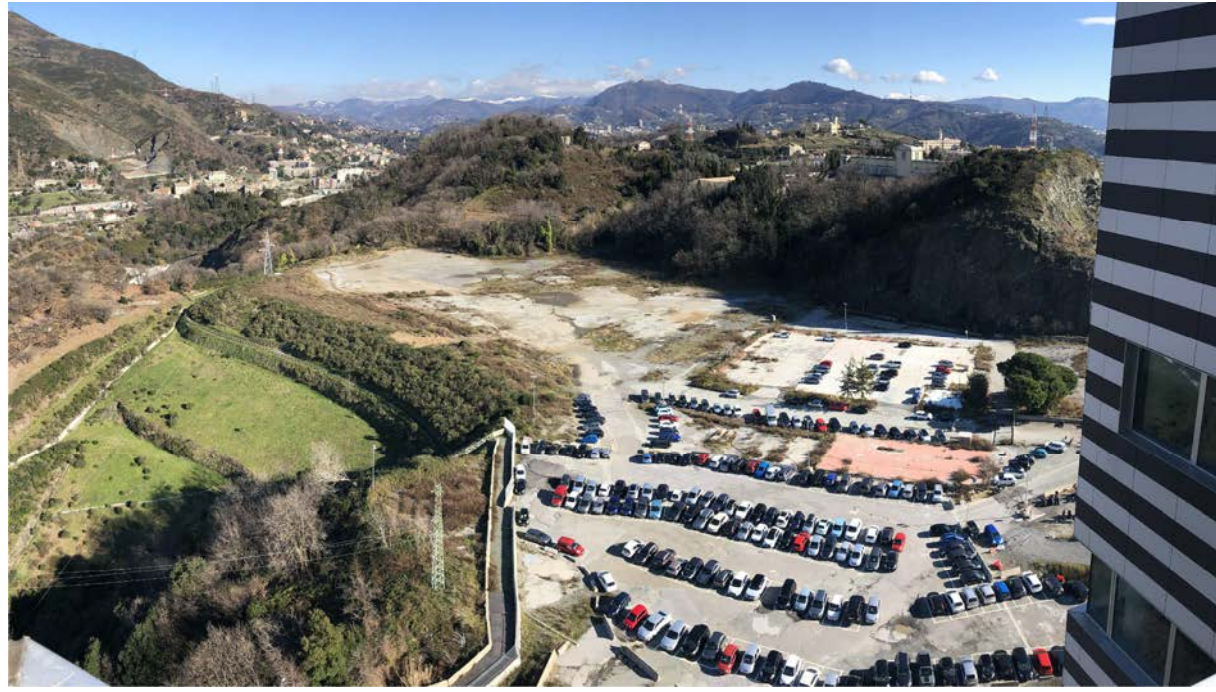
11 Vista verso Cornigliano