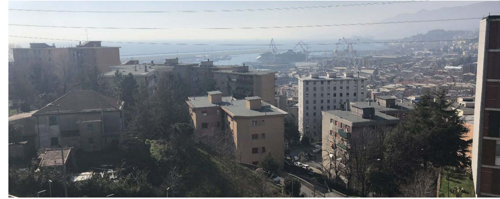
12 Vista verso Ponente