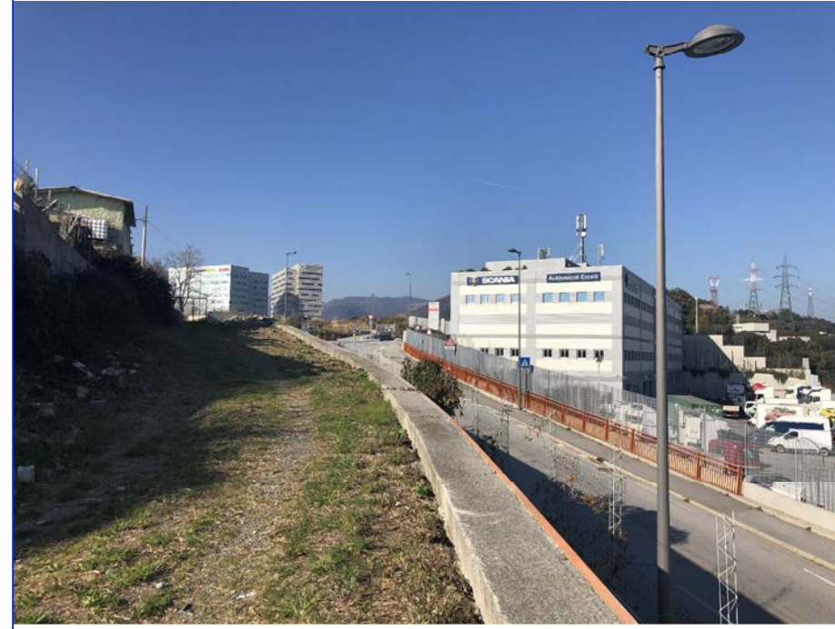
19 Vista verso nord-ovest da via Alessandro Vallebona