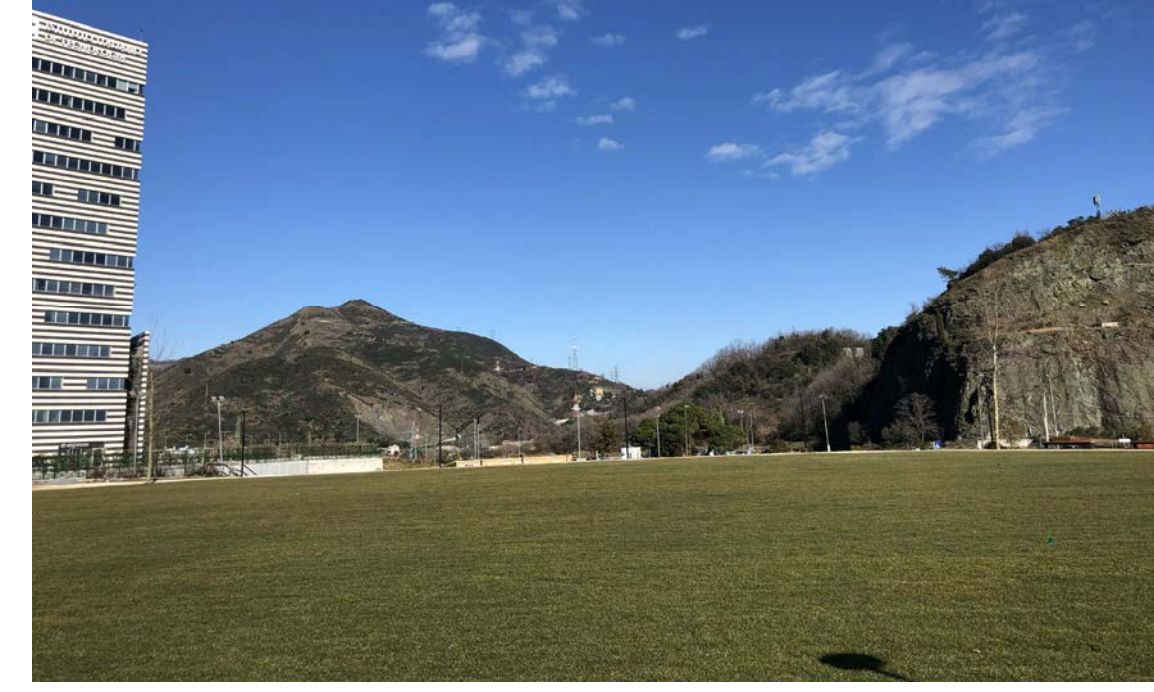
26 Vista dal Parco verde