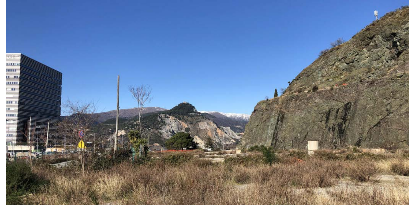
17 Vista verso nord-ovest