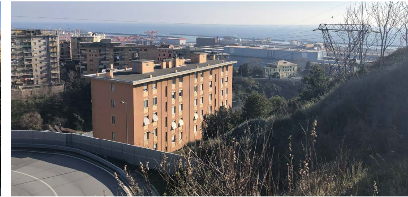
6 Vista verso Sud dalla via Vallebona