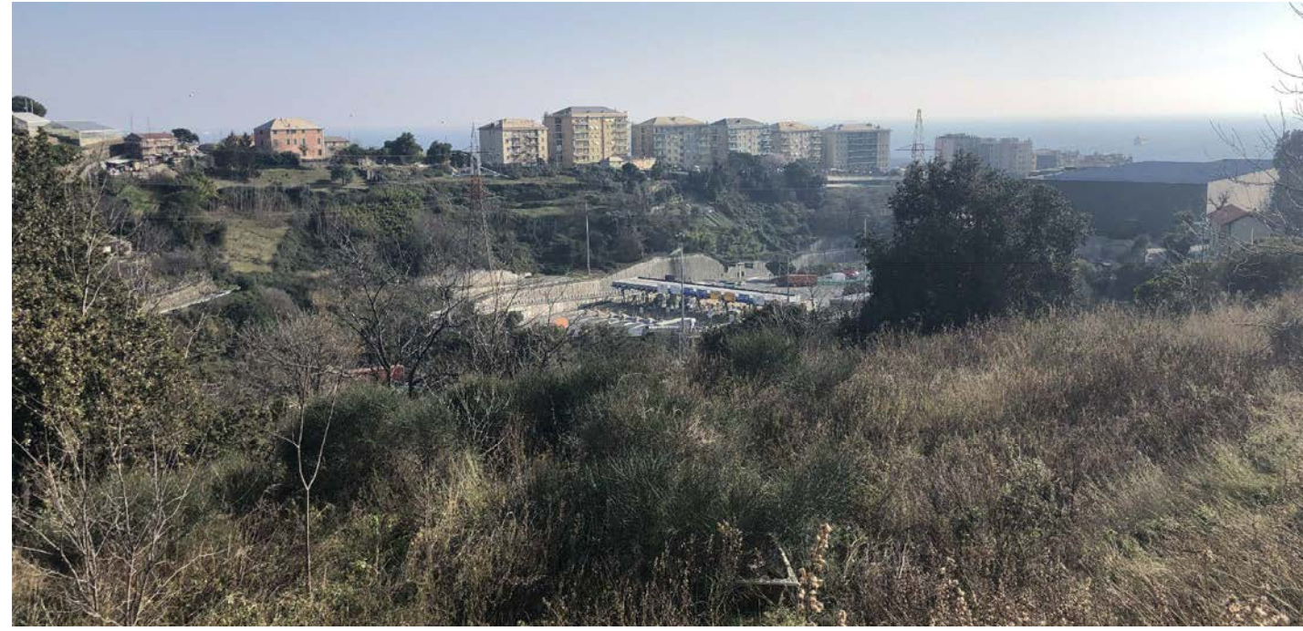
15 Vista dall'area verso la collina di Coronata