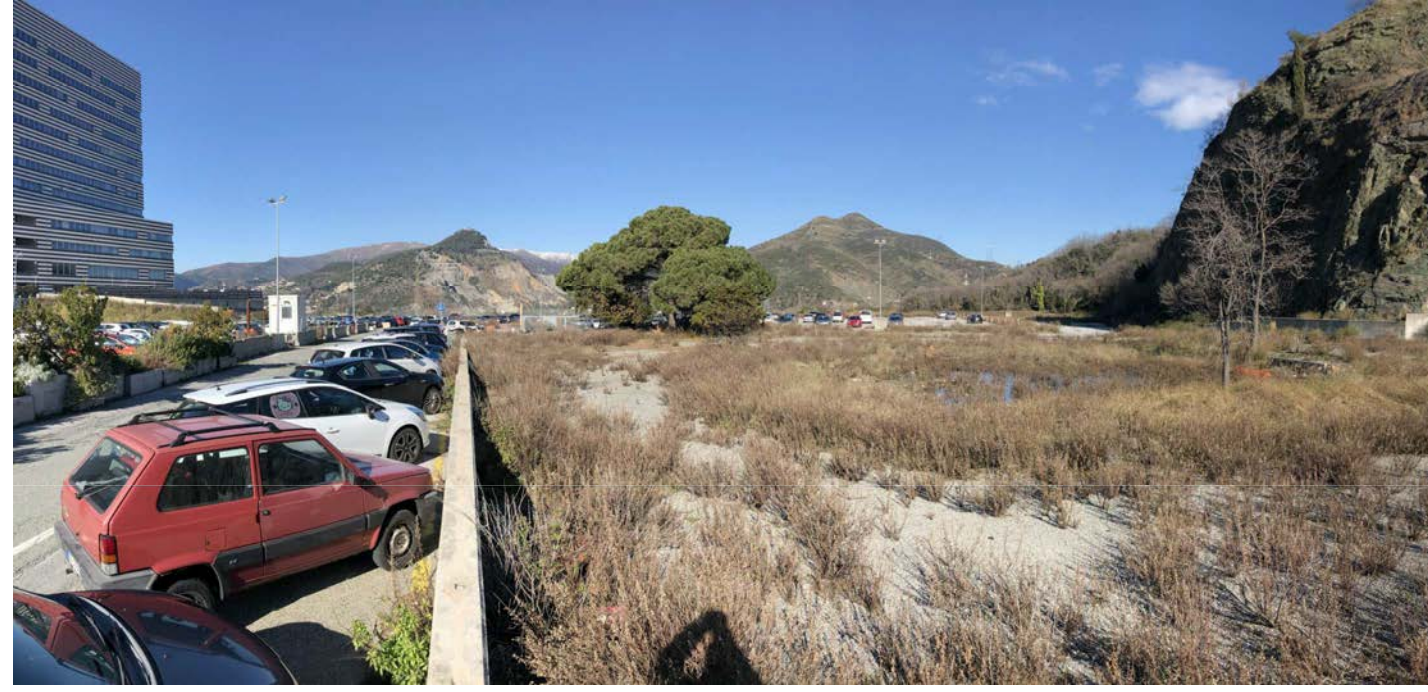
18 Vista verso nord-ovest