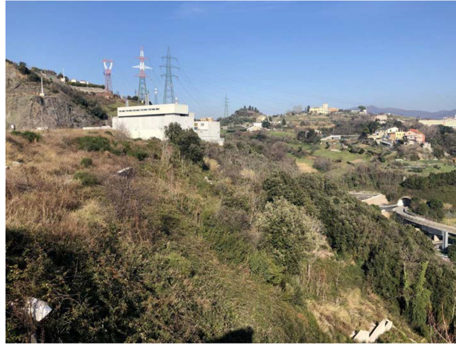
21 Vista verso est da via Erzelli