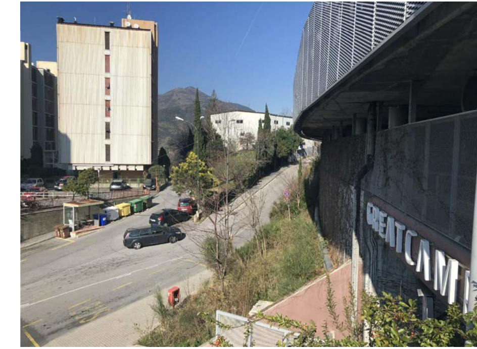
8 Vista su via Enrico Melen