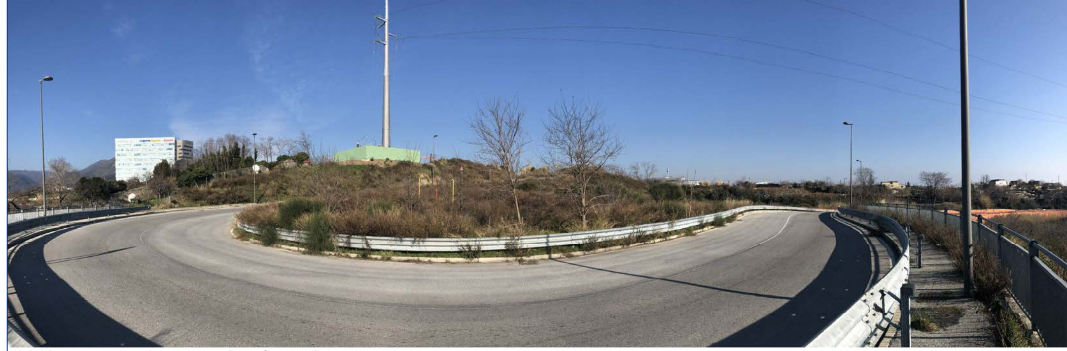
23 Vista verso nord-est da via Pier Giorgio Perotto