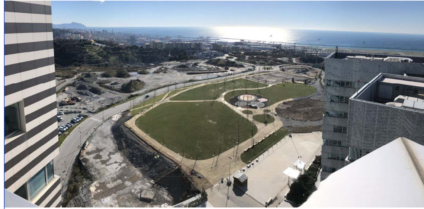
10 Vista sul Parco Verde