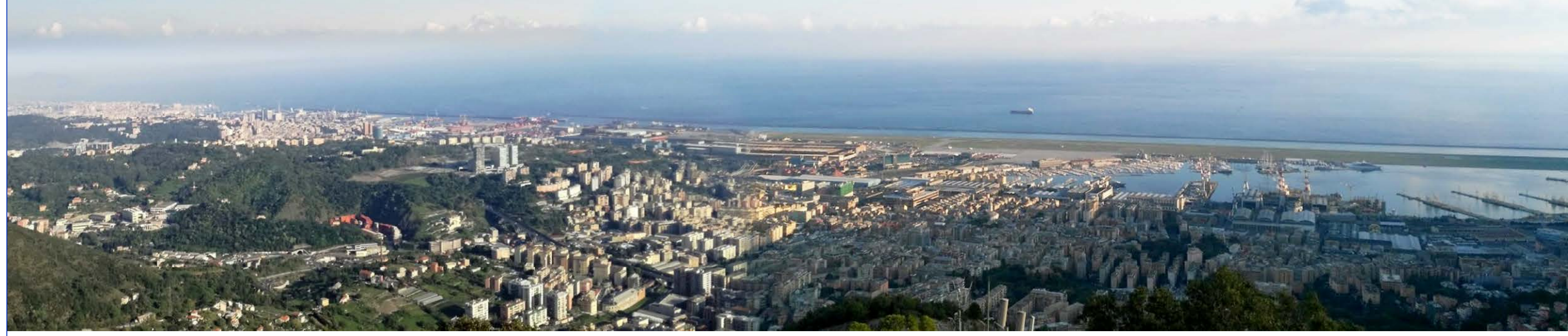
25 Vista dal Monte Gazzo