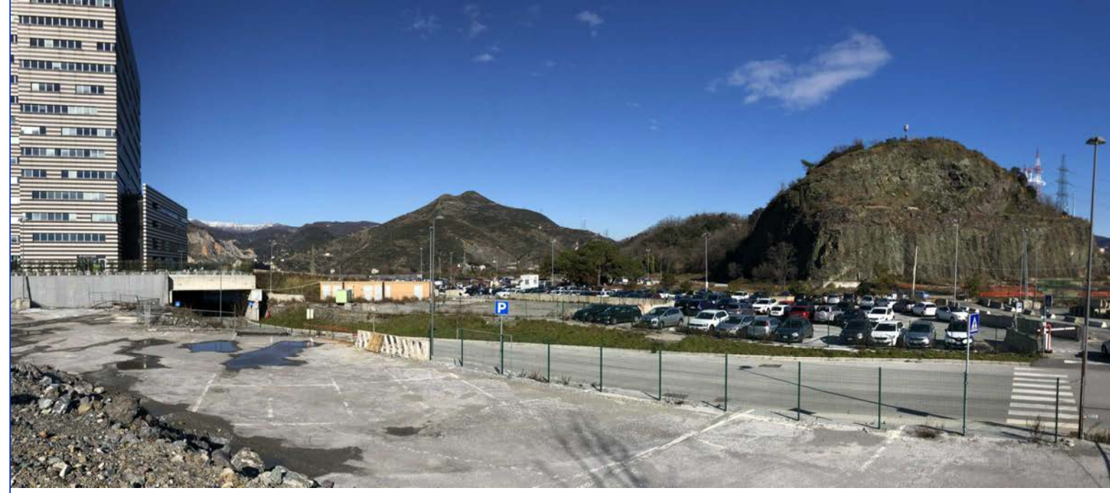
16 Vista verso nord dal parco verde