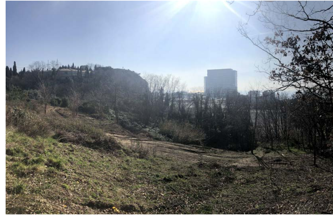
14 Vista verso sud