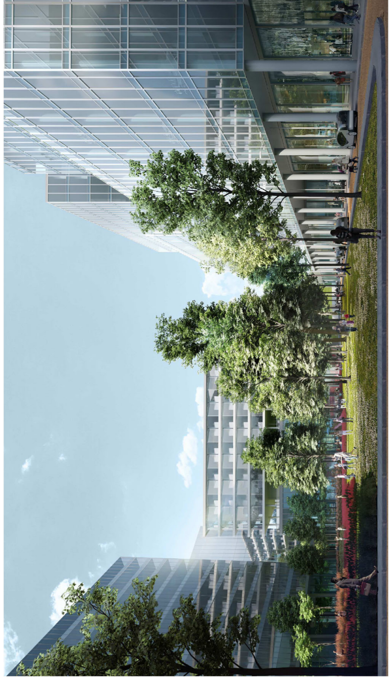
05 Piazza giardino - verde su struttura