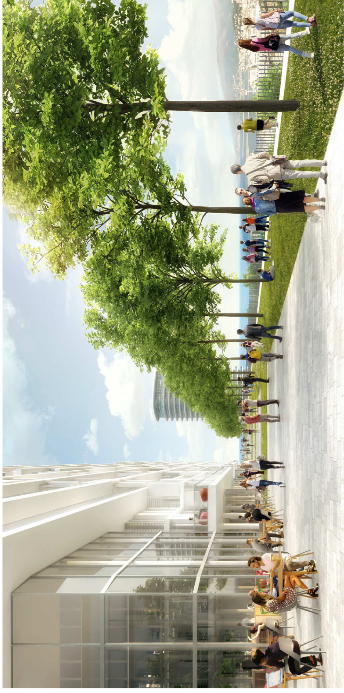
02 Sistema residenziale di ponente; promenade panoramica