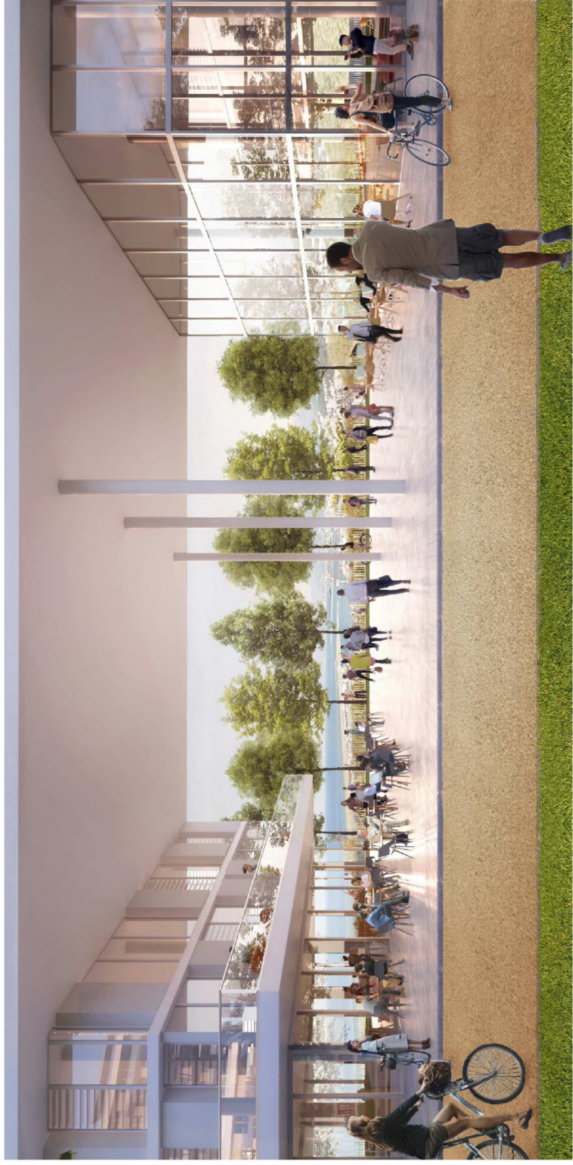
01 Sistema residenziale sollevato da terra su alti pilotis