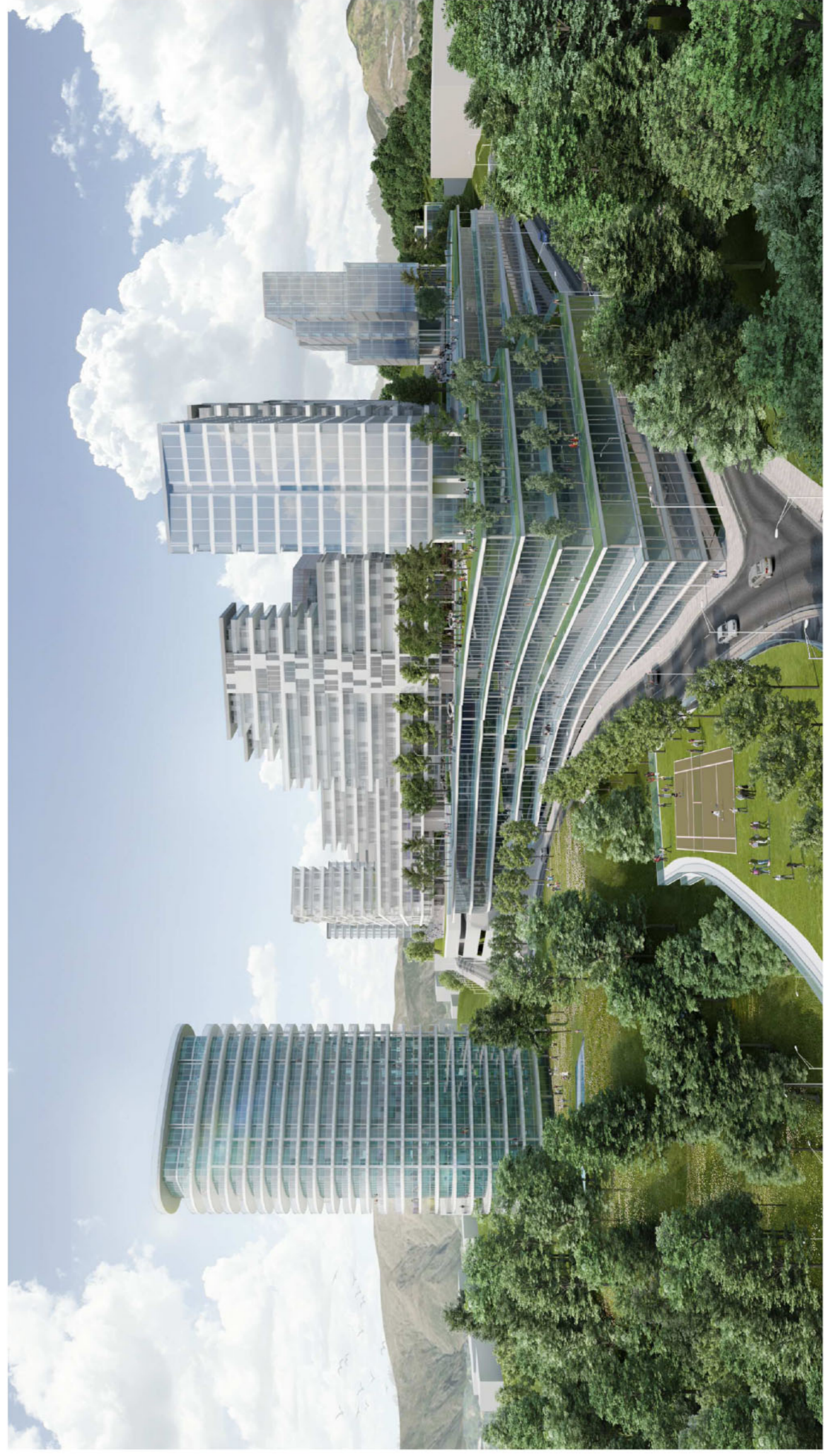
04 Il sistema a "pnea": stratificazione tra uffici, laboratori e hotel