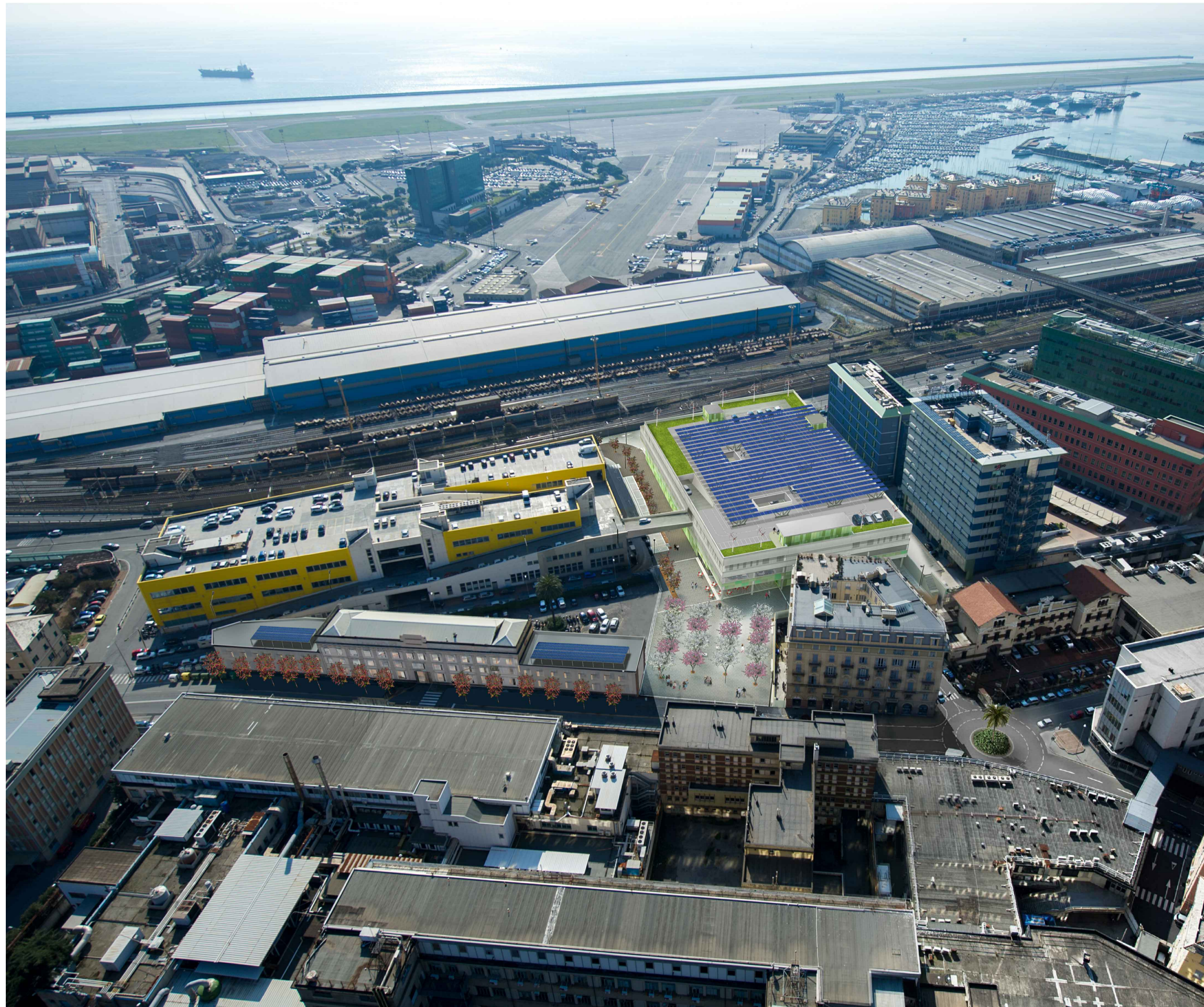
STATO DI PROGETTO - VISTA DA NORD