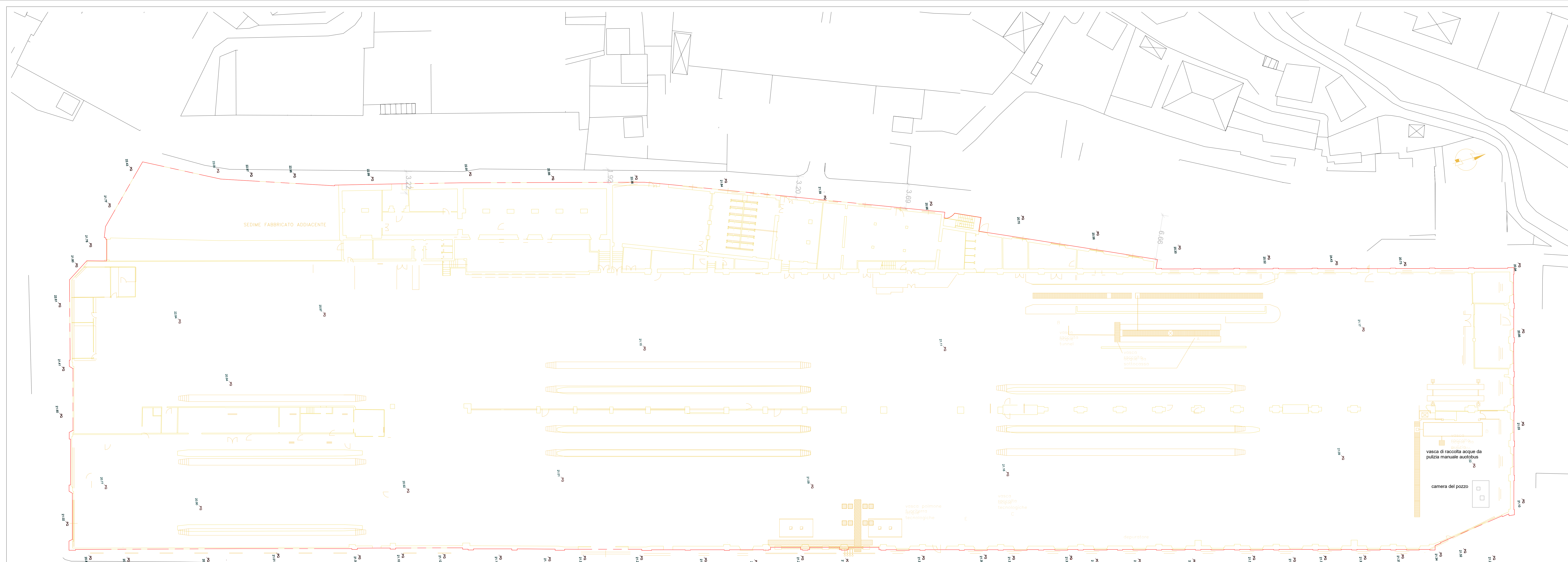
PLANIMETRIA GENERALE - DEMOLIZIONI Scale 1: 200