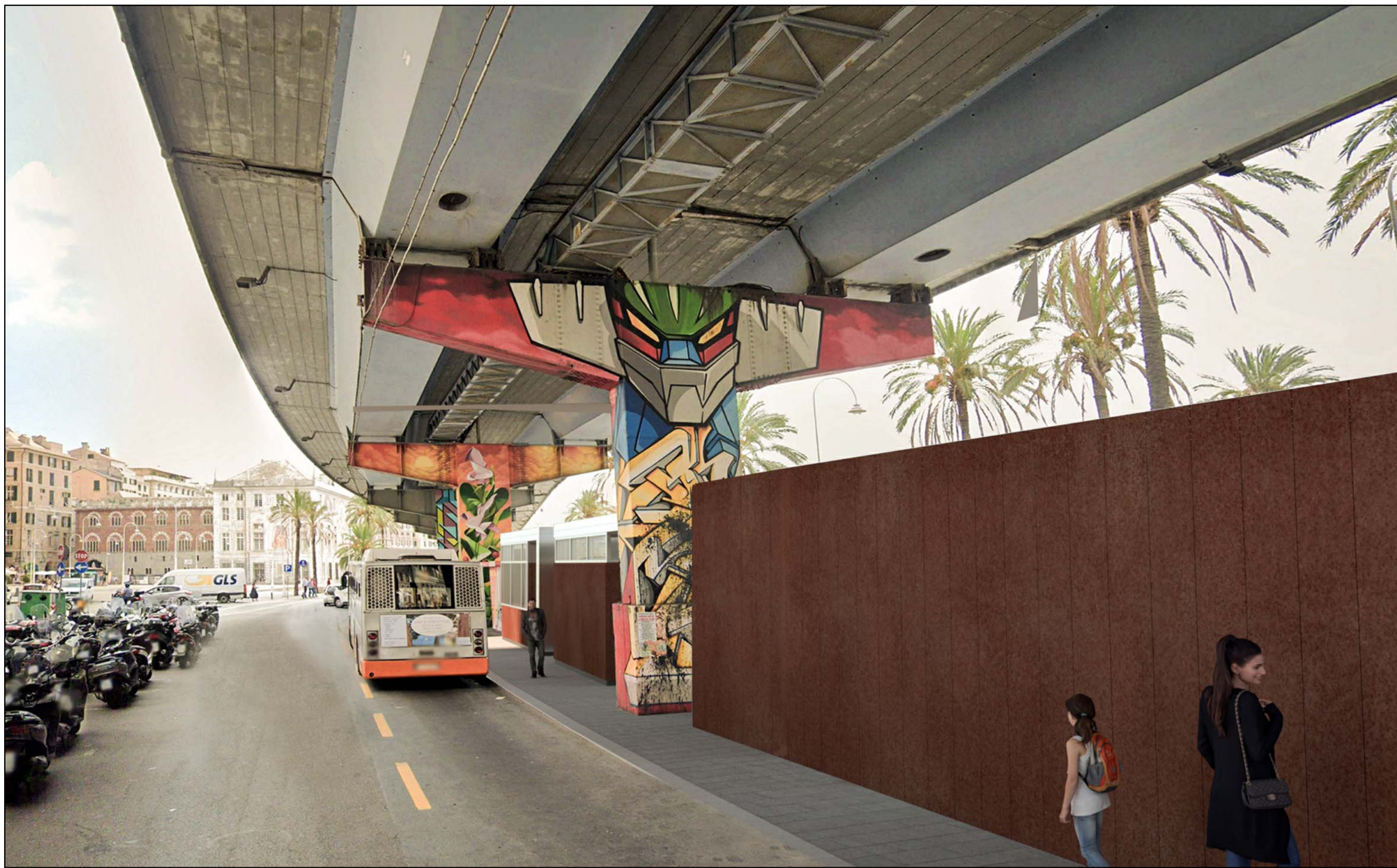
1 Vista dalla quota urbana