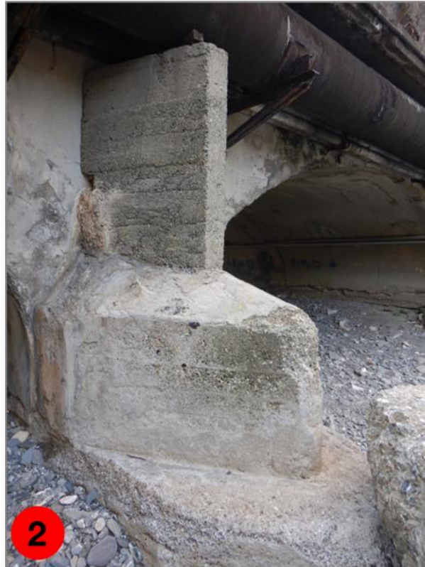
Figura 2: Rostro centrale in cemento a monte della pila centrale