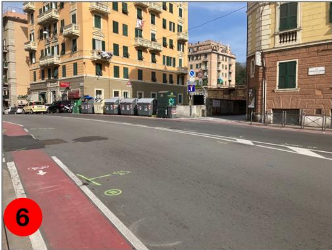
Figura 6: Vista da via Canepari, a valle della spalla sud del ponte