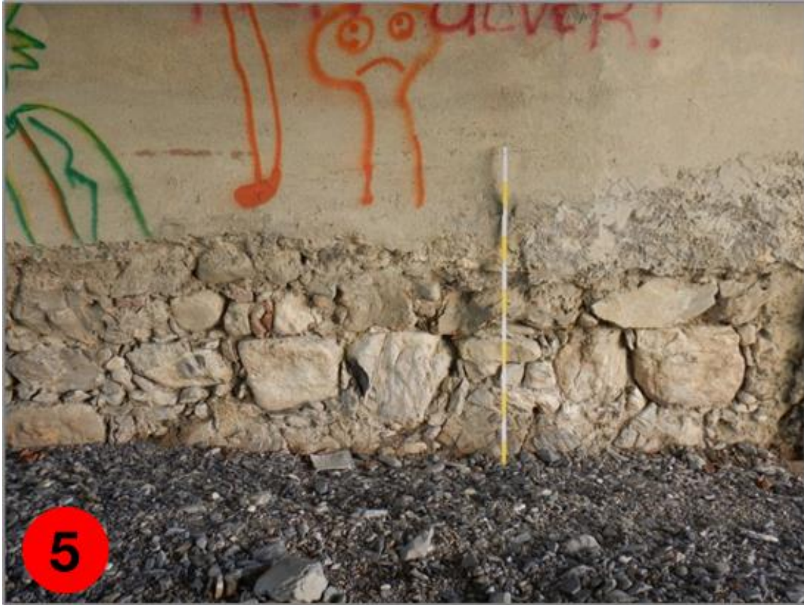
Figura 5: Particolare del corpo centrale del muro di spalla sinistra (sud) del ponte