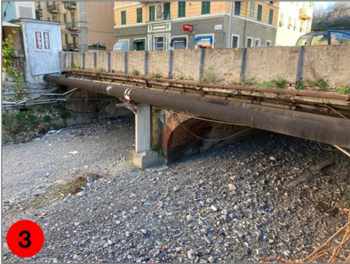
Figura 3: Vista del ponte del lato di valle idraulico (da sud-ovest), da Passo Torbella