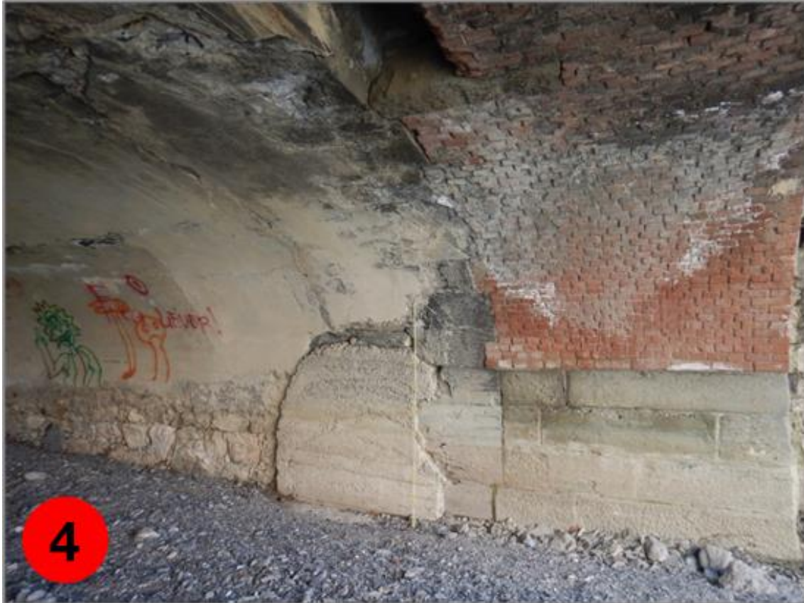
Figura 4: Vista dell'arcata interna e spalla sinistra (sud) del ponte di via Canepari