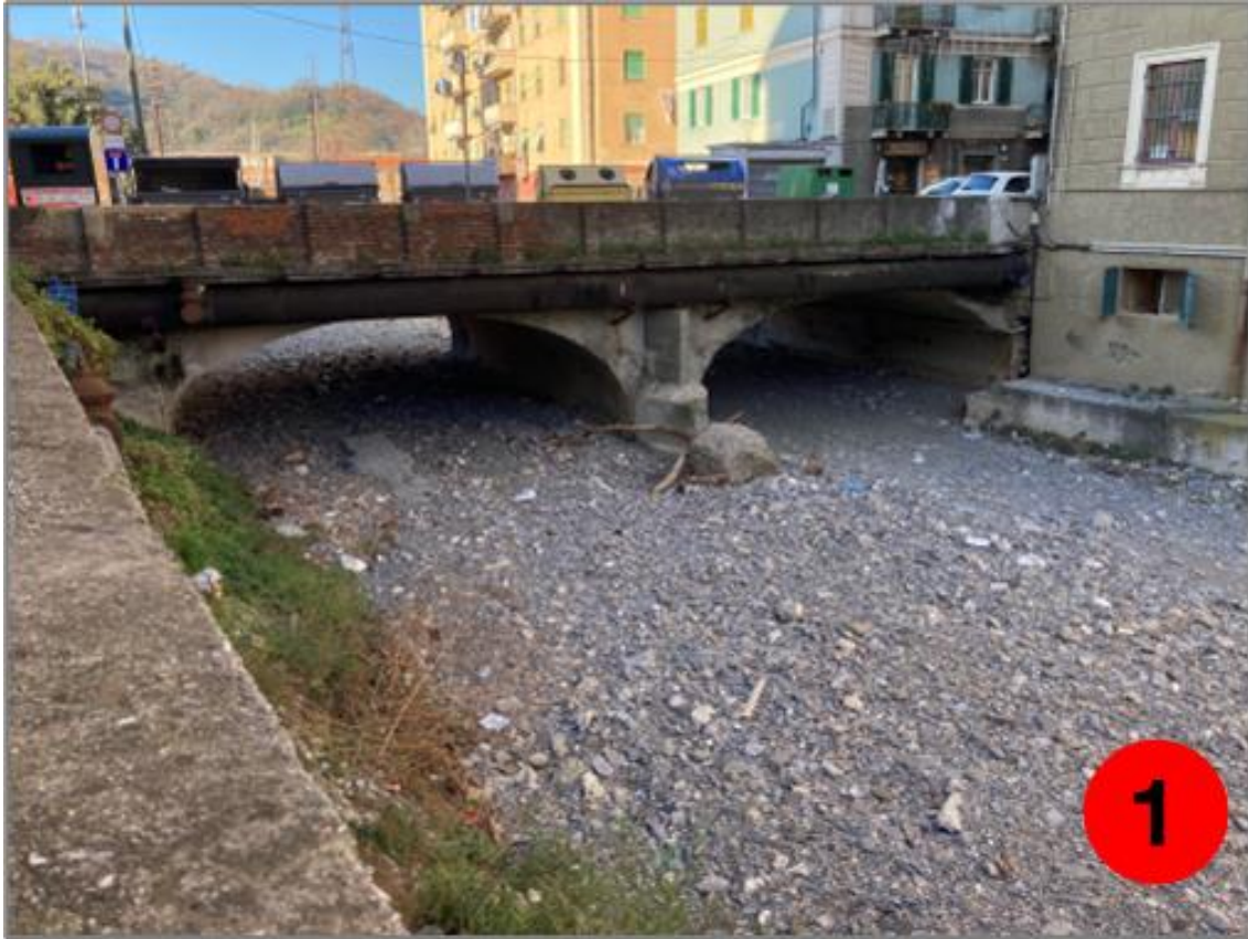
Figura 1: Vista del ponte del lato di monte idraulico (da sud-est), da Passo Torbella