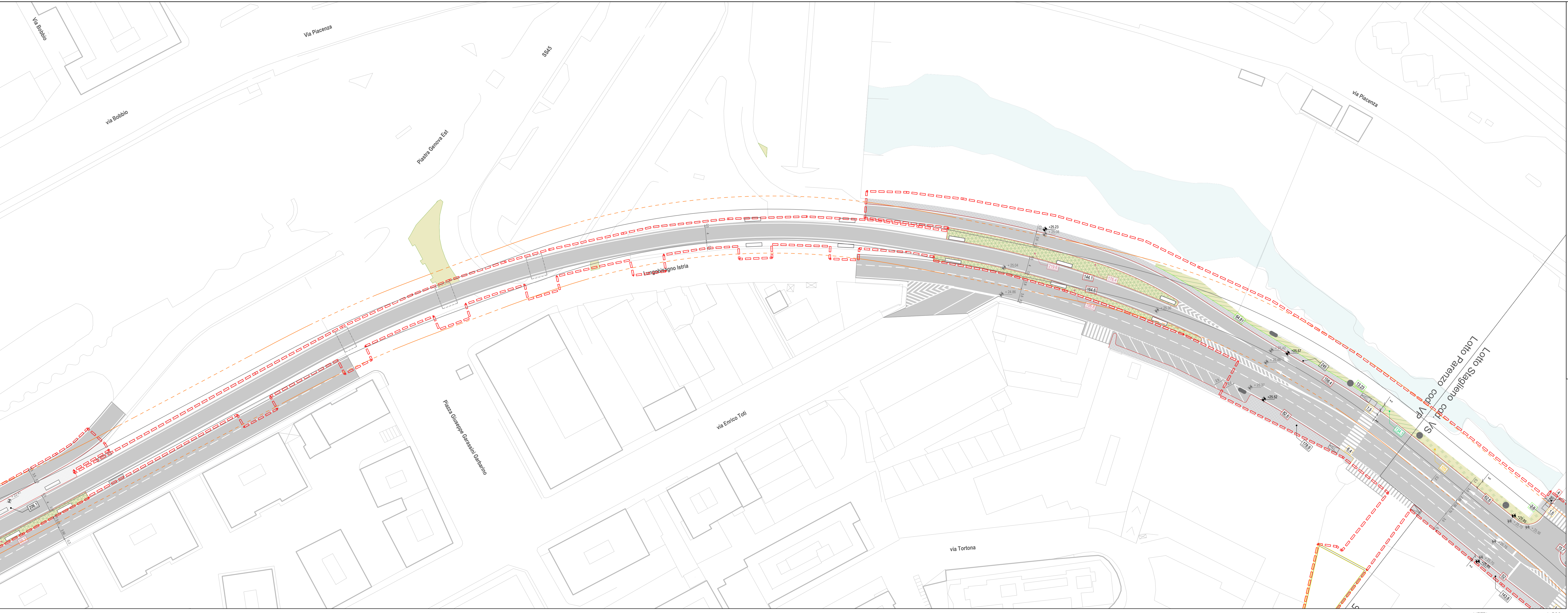
01 PLANIMETRIA GENERALE 1.500