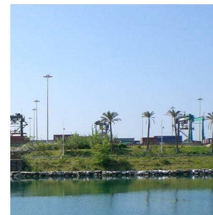
Percorso lungo il canale di calma di Pra'

Il carattere artificiale che la contraddistingue deriva dalla loro genesi, funzionale soltanto alla creazione di un'area franca, una doppia fascia d'acqua e di terra, realizzata per il "rispetto" dell'abitato di Pra' nei confronti delle attrezzature portuali sorte sul riempimento costiero antistante la delegazione. Il bacino idrico parallelo all'antica spiaggia, detto canale di calma, fa da collettore ai torrenti che un tempo raggiungevano il mare in quel tratto di costa. A sud vi sono gli ambiti portuali, verso terra quelli retroportuali, formalmente urbani ma ancora di proprietà demaniale, hanno sostituito l'originario litorale. Quest'ambito aveva vissuto, già in epoche remote come tutto il Ponente