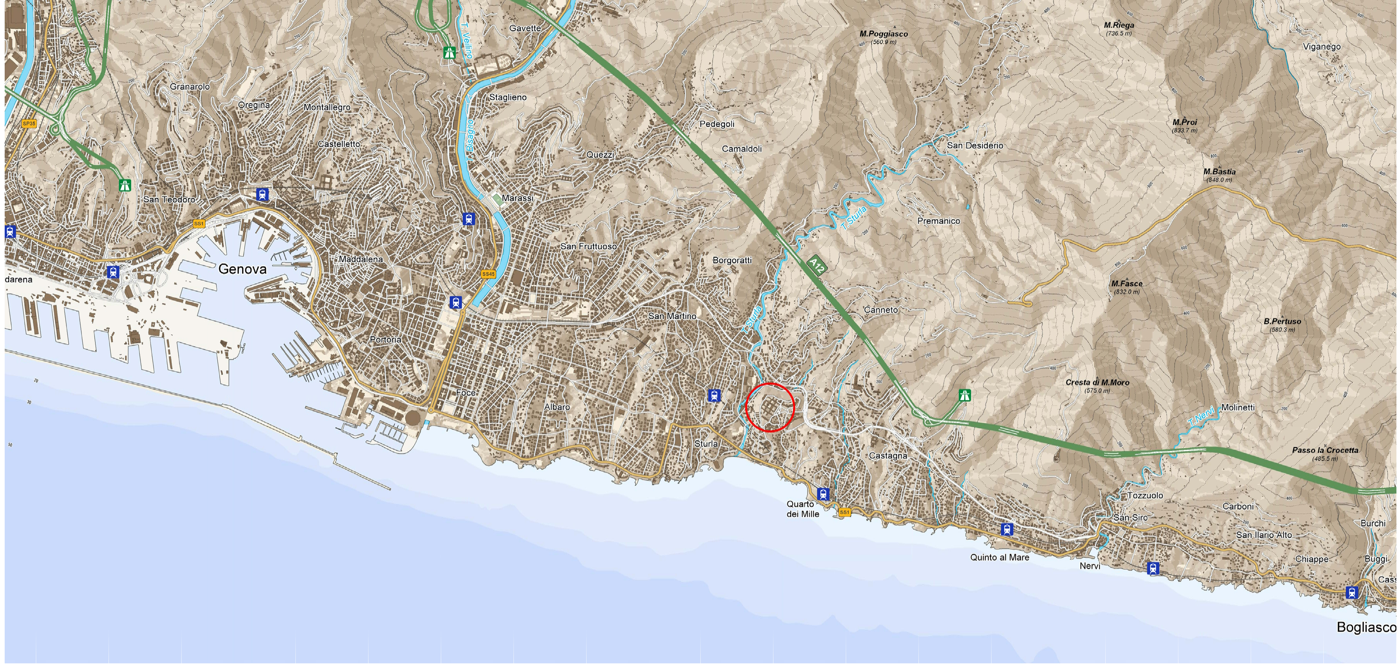
MAPPA REGIONALE - SCALA 1:25000